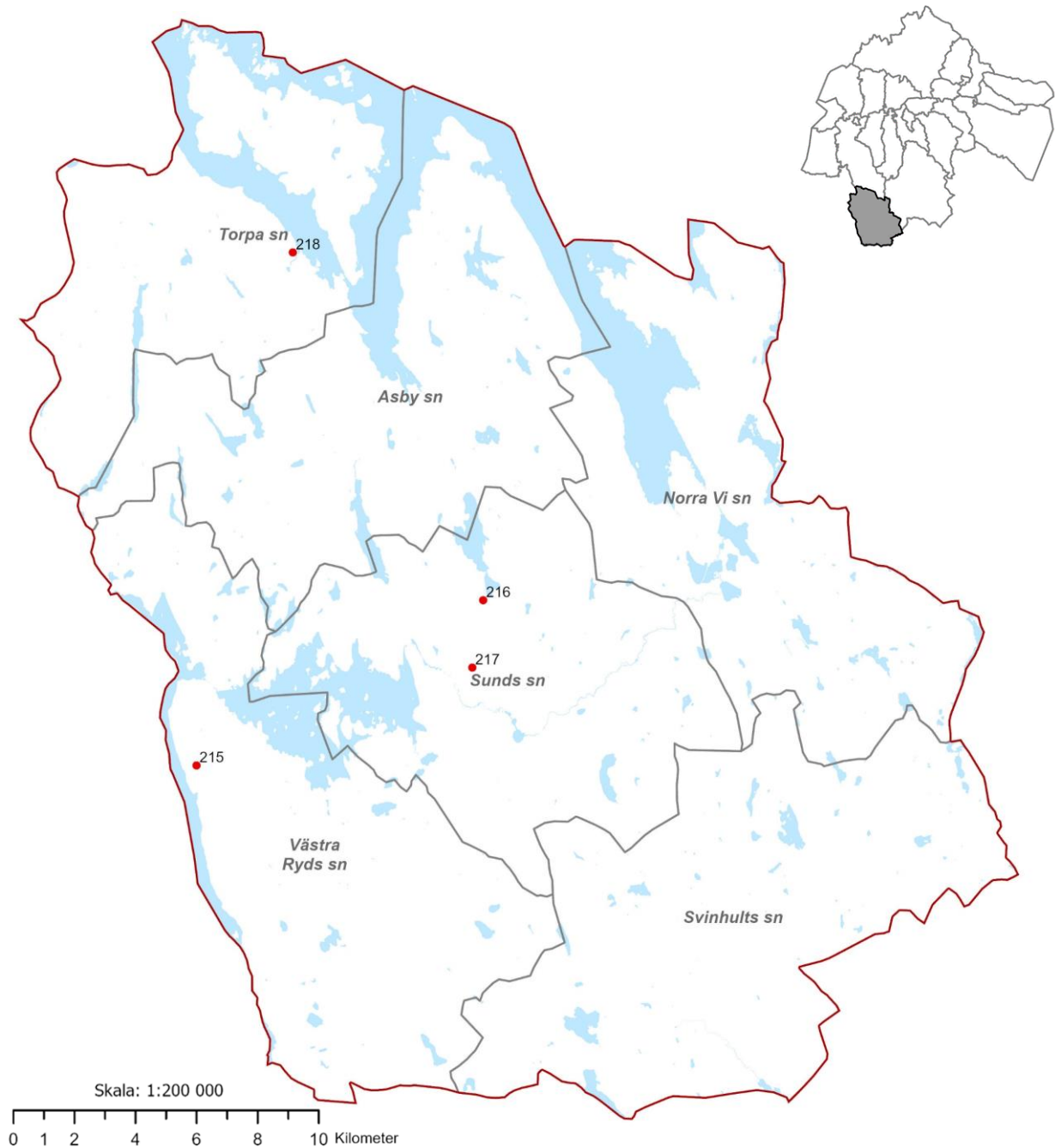
Fig. 222. Karta över runinskrifterna i Ydre härad.

I denna situation har ingen förändring inträffat. 1