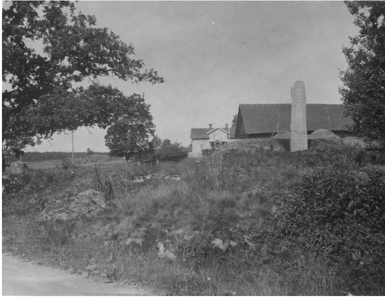
Plansch 120a. Ög 217. Oppeby, Sunds sn. Foto Nordén 1947.