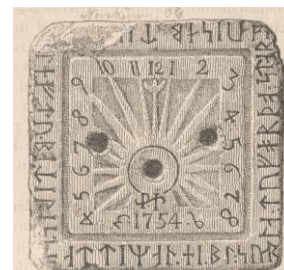
Fig. 164. Norrköping, Sankt Olai kyrka. Efter KVHAAs Månadsblad 1877, s. 492.