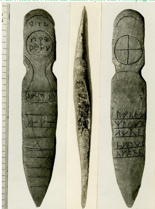
Fig. 165. Norrköping, Trädgårdsgatan 47.