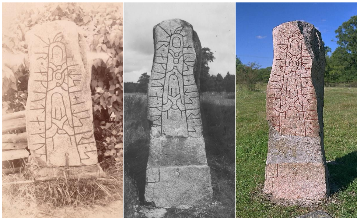
Fig. 1. Ög 190. Nybble ägor, Vikingstads sn.

Även om sålunda arbetet är föråldrat och även om bildmaterialet bitvis är under all kritik, har manuset ett värde. Om inte annat kommer det behöva användas när Runverket i sinom tid återupptar arbetet på en ny upplaga av Östergötlands runinskrifter . Det blir en efterlängtdad nytgåva där, utöver nya läsningar och tolkningar, långt mer än 100 runfynd sedan Nordén skrev sitt manus kommer att publiceras.