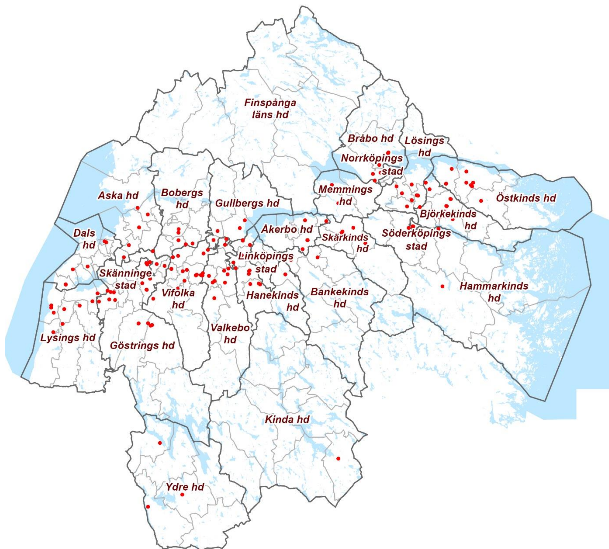
Fig. 3. Karta över Östergötland med häradet och socknar jämte de i utgåvan medtagna runinskrifterna.

Efter Nordéns arbete med supplementet har många runfynd gjorts i landskapet. Antalet poster från Östergötland i Samnordisk runtextdatabas (version 2014) är 486 stycken – varav flera fragment inte sällan förts upp under ett och samma nummer. Cecilia Ljungs katalog med tidigkristna gravmonument (Ljung 2016) innehåller 363 hållar och fragment. Många fynd har gjorts i Skänninge och Hov, för de senare se S. B. F. Janssons arbete Stenfynden i Hovs kyrka (Jansson 1962). Men en stor del av materialet återstår fortfarande att få ordentligt behandlat och publicerat.