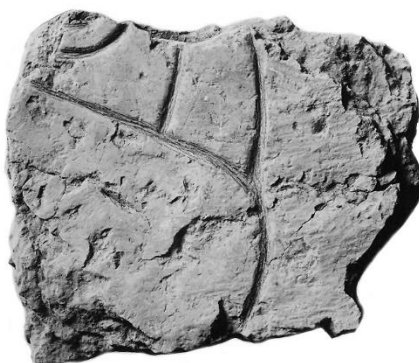
Fig. 133. 270. S:t Lars kyrka, Linköping.

I koret var det äldsta golvet på två ställen avbrutet av trappsteg. Det nedre av dessa låg ett stycke framför absiden och bestod av två skikt av tunna, tuktade kalkstenar. Det övre skiftet var vid ändan upplagt på norra korsarmens sockelskift. Yttersta stenen härvid utgjordes av ett litet stycke, som tydligen tillhört en gravvård av Eskilstuna-sarkofagens typ. Ett annat liknande stycke anträffades i korgolvet strax framför övre steget. — Fragmenten förvaras nu i Östergötlands museum. 10