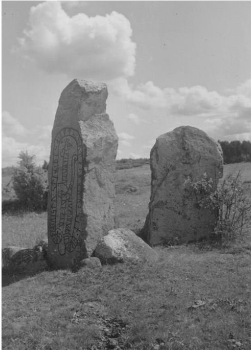
Plansch 59a. Ög 99. Hov, Mogata sn. Foto Nordén 1942. [Jansson skriver 1947: bra]