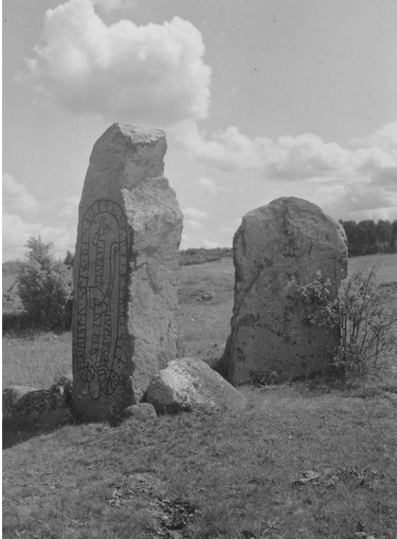
Plansch 59a. Ög 99. Hov, Mogata sn. Foto Nordén 1942. [Jansson skriver 1947: bra]