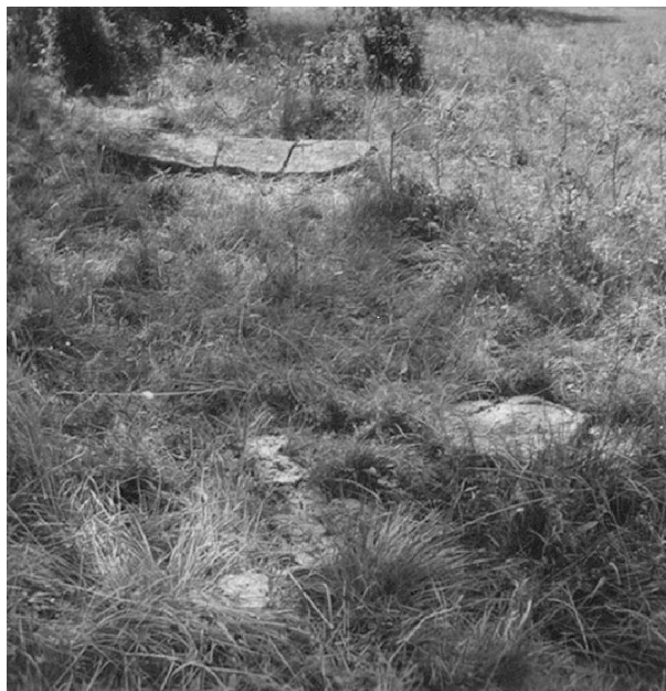
Fig. 103. Ög 98. Strålnäs, Åsbo sn. Vid fotot står: »Runstenen samt i fgr. den kvarstående foten.» Foto N. Olsson 1945, dnr. 3153/45 (ATA).