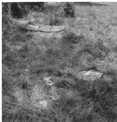
Fig. 103. Ög 98. Strålnäs, Åsbo sn. Vid fotot står: »Runstenen samt i fgr. den kvarstående foten.» Foto N. Olsson 1945, dnr. 3153/45 (ATA).