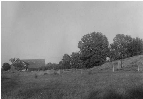
Plansch 53a. Ög 93. Haddestad, Väderstads sn. Foto Nordén 1946. [Jansson skriver 1947: Översiktsbild ej bra]

Till läsningen: Brate läser 22 som i, men en punkt låter iakttaga sig i mitten, varför även denna runa bör läsas som e.