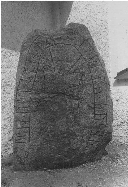
Fig. 99. Ög 91. Järstads kyrkogård. 1946. Om fotot anges i ATA »Korset ifyllt.» Jämför med Plansch 54b där korset är ditretuscherat.