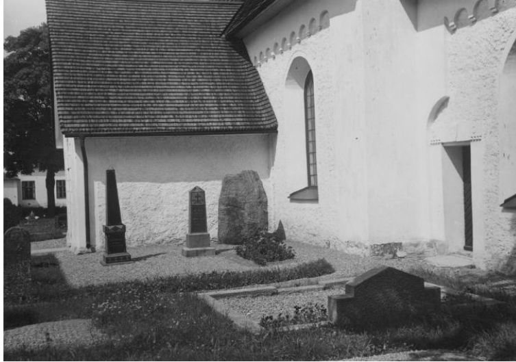
Plansch 52b. Ög 91. Järstads kyrkogård. Foto Nordén 1946. [Jansson skriver 1947: Duger]

Brate motiverar ej, varför han upptager blott en så obetydlig del av den av äldre avbildare, främst Bautils tecknare, så fylligt återgivna ornamentiken. Vid god belysning framträder denna dock på stenen i ungefär den omfattning, som jag å mitt foto avgivit.