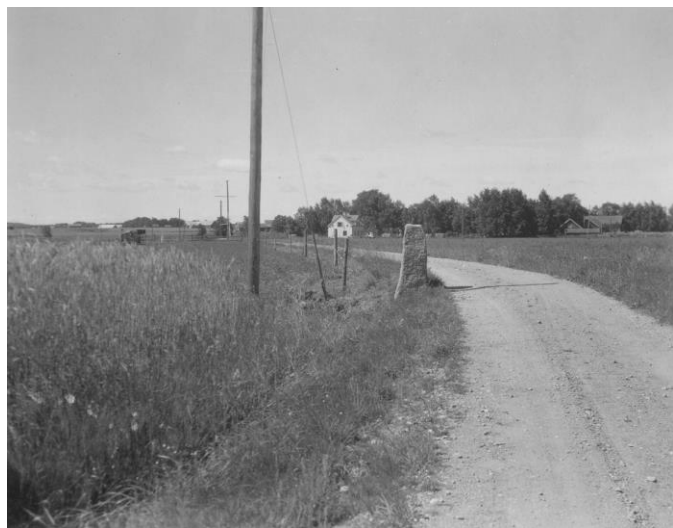
Plansch 52a. Ög 88. Axstad, Högby sn. Foto Nordén 1946. [Jansson skriver 1947: Bra]