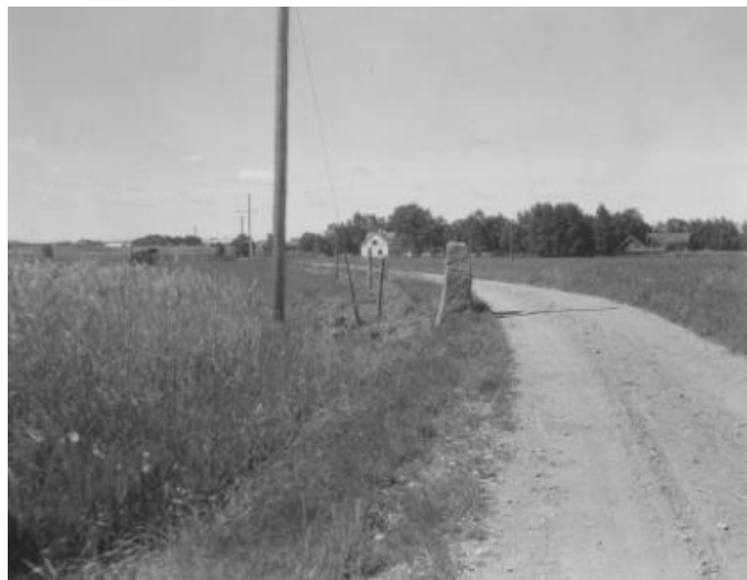
Plansch 52a. Ög 88. Axstad, Högby sn. Foto Nordén 1946. [Jansson skriver 1947: Bra]