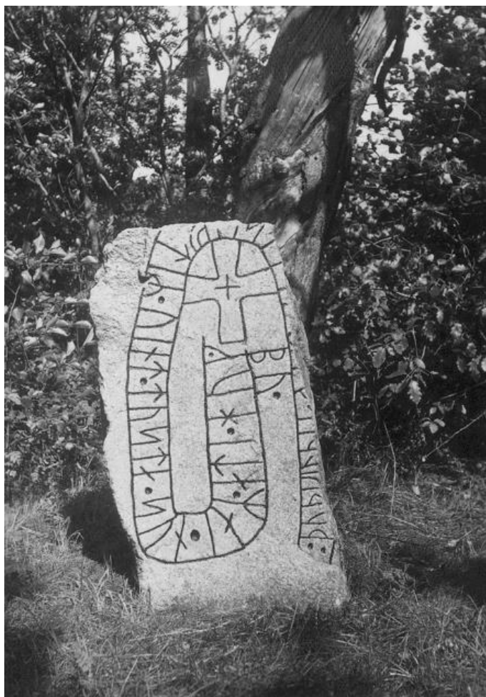
Plansch 50a. Ög 82. Högby forna kyrka, nu prästgårds- parken. Foto Nordén 1946.