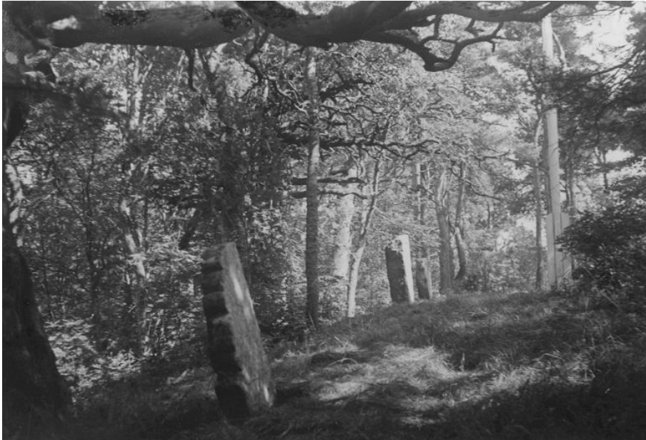
Plansch 47b. Ög 82, 83, 87. Högby forna kyrka, nu prästgårdsparken. Foto Nordén 1946. [Jansson skriver 1947 om bilderna till pl. 47: Översiktsbilder möjliga]