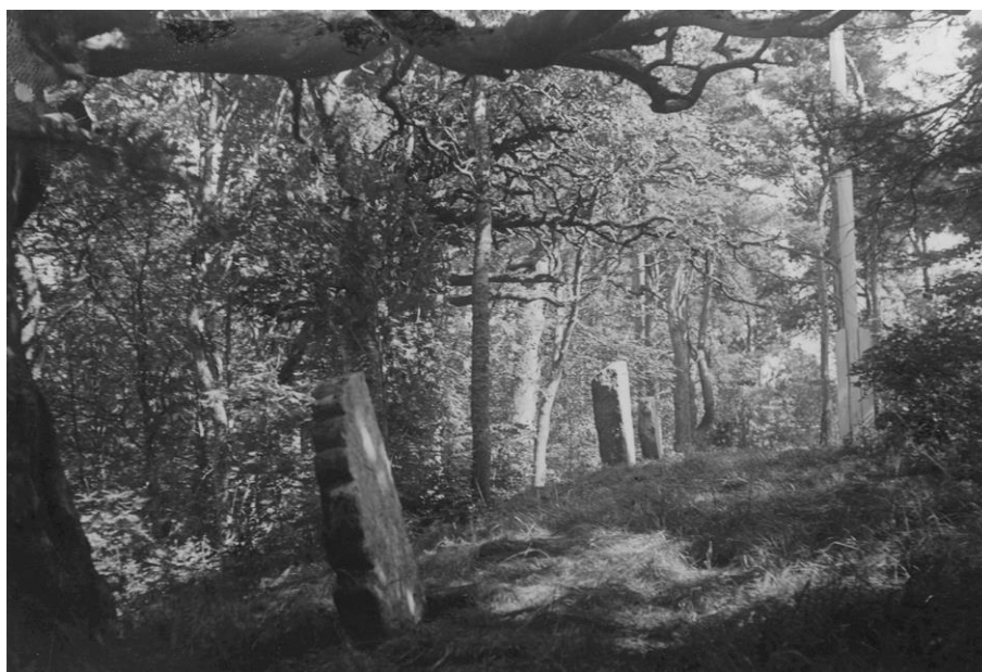
Plansch 47b. Ög 82, 83, 87. Högbys forna kyrka, nu prästgårdsparken. 1946. [Jansson skriver 1947 om bilderna till pl. 47: Översiktsbilder möjliga]