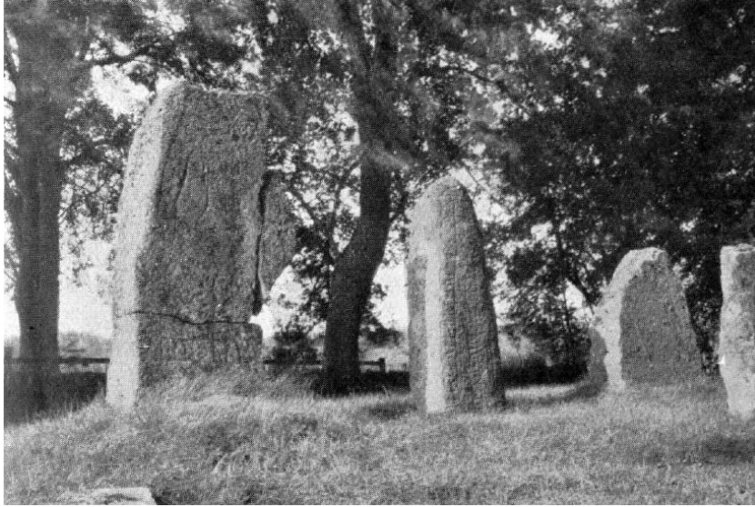
Fig. 90. Ög 70, Ög 68, Ög 67, Ög 69. Ekeby kyrka.