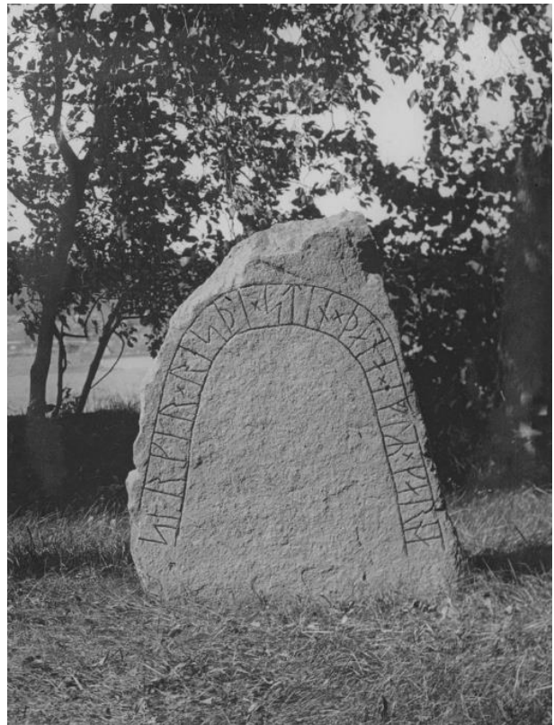
Plansch 43a. Ög 67. Ekeby kyrka. Foto Nordén 1946.

Punkten i 8 e är oomtvistlig, medan 14 i saknar punkt, i 20 e är den vag men nog ändå säker. Intet sk vare sig i början eller slutet.