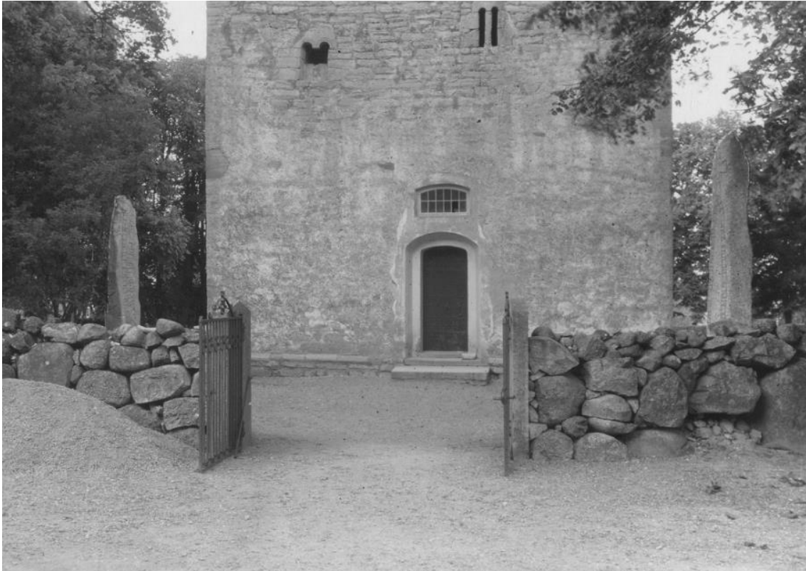
Plansch 39b. Ög 64, Ög 66. Bjälbo kyrka. Foto Nordén 1946. [Jansson skriver 1947: Om retuschen borttas Översiktsbild]