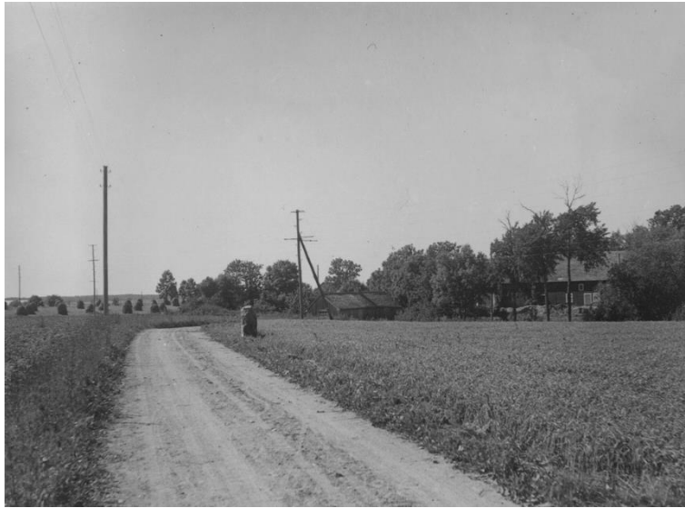
Plansch 39a. Ög 63. Vistena, Allhelgona sn. Foto Nordén 1946. [Jansson skriver 1947: Översiktsbild duger.]