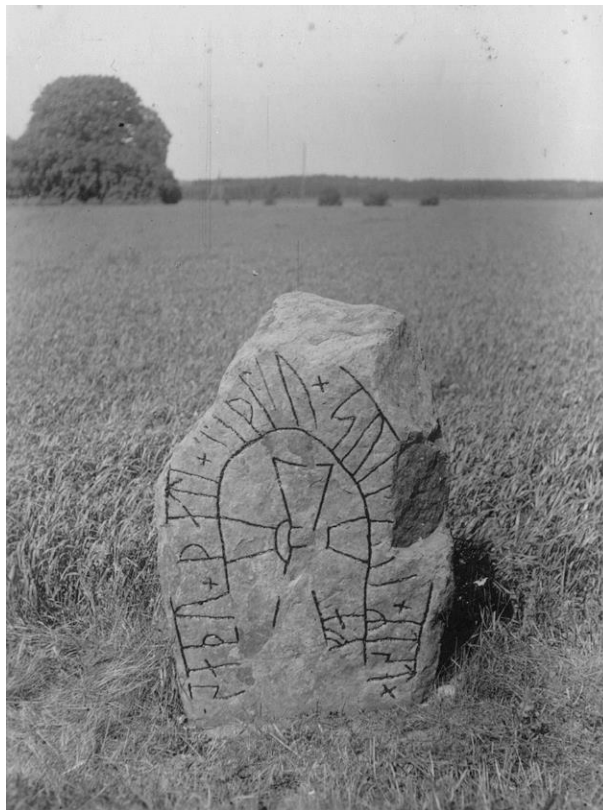
Plansch 40a. Ög 63. Vistena, Allhelgona sn. Foto Nordén 1946. [Jansson skriver 1947: Obetydligt retusch. För liten.]