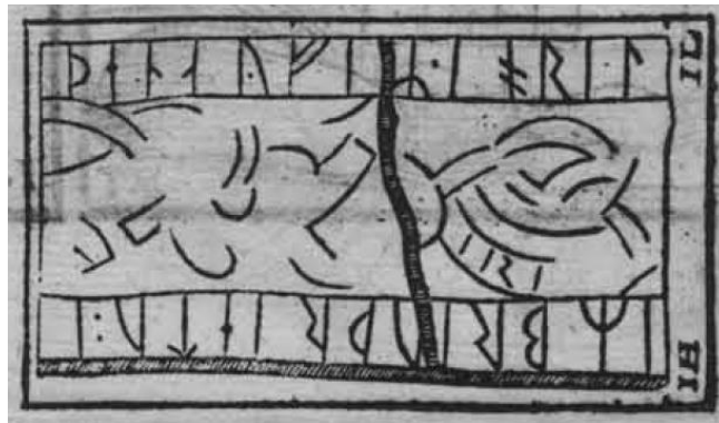
Fig. 60. Ög 52. Väversunda kyrka. Efter B 872.

Det nu skadade personnamnet för i erinran fvn. namn av typen Jórunn , Jórdan , Jórekr , Jórheiðr , Jóriðr , Jórufr . Den öländska stenen Öl 25 har skrivningen ioruitr , sannolikt för Jörundr .