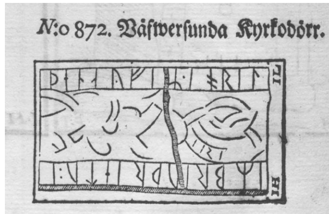
Fig. 60. Ög 52. Väversunda kyrka. Efter B 872.

Det nu skadade personnamnet för i erinran fvn. namn av typen Jórunn , Jórdan , Jórekr , Jórheiðr , Jóriðr , Jórulfr . Den öländska stenen Öl 25 har skrivningen ioruitr , sannolikt för Jörundr .