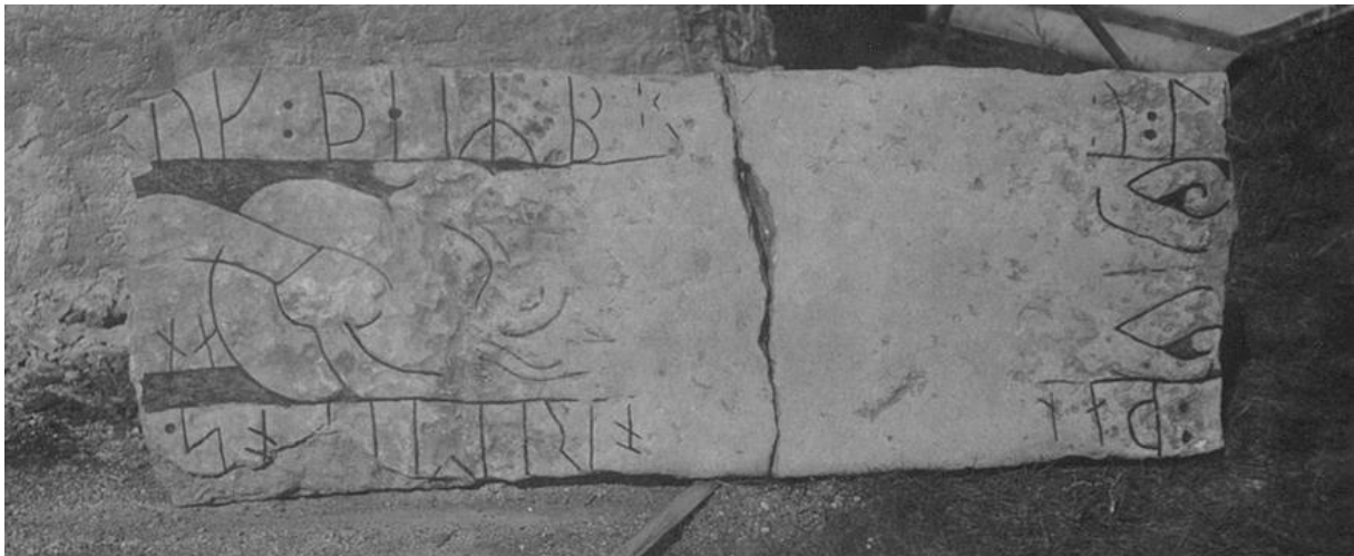
Plansch 25a. Ög 52. Väversunda kyrka. Foto Nordén 1947. [Vid bilden står: »Frigöres» och Jansson skriver 1947: liten, dålig.]

Till läsningen: 8 R. 1, endast högra delen av bst till ett a . 2–3 uk tydliga, därpå ett tydligt kolon och ett ännu skönjbart parti 4–7 peir . Därefter ett svagt synligt kolon. R. 8 är ett b , varav hst svagt synes och likaså nedre bågen, medan av övre bågen blott ett otydligt spår återstår. Av r. 9 r ( Bautil ) finnas endast ytterst svaga antydningar, och sedan är allt borta av Bautils u pritt (ovan restituerat som u pr :