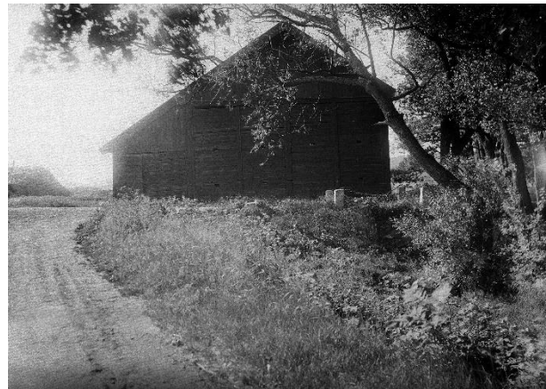
Fig. 56. Ög 45. Björnsnäs, Kvillinge sn. Foto A. Nordén 1936 (ATA). Vid fotot står »Bron, som omtalas i runristningen.« Oretuscherat foto, jämför plansch 22b.