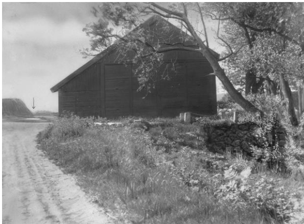
Plansch 22b. Ög 45. Björnsnäs, Kvillinge sn. Foto Nordén 1936. [Vid planschen står »Ljusare!» Jansson skriver 1947: »Översiktsbilden målad duger ej». Notera pilen som anger var runristningen är belägen. Jämför figur 56.]