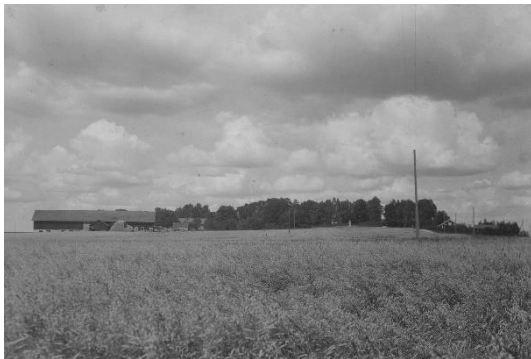
Plansch 16. Ög 38. Boberg, Fornåsa sn. Foto Nordén 1945. [Vid planschen står om den nedre bilden »Hålles ljusare vid tagningen!» Något retuscherade. Jansson skriver 1947: Kontroll]