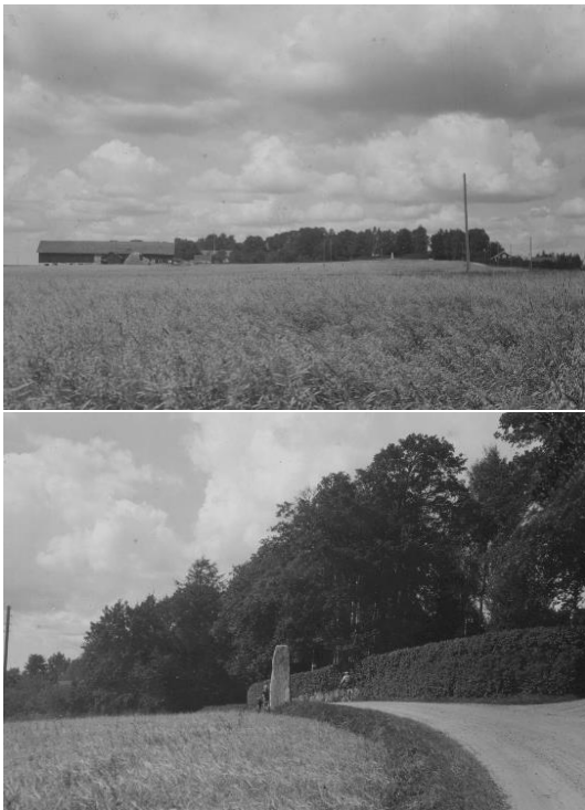
Plansch 16. Ög 38. Boberg, Fornåsa sn. Foto Nordén 1945. [Något retuscherade. Jansson skriver 1947: Kontroll]