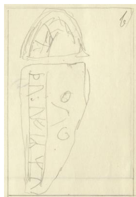
Fig. 191. 286. F.d. franciskanerklostrets kyrka, Söderköping. Nordéns skiss till utformning av plansch 98b.

Plansch 98b. 286. F.d. franciskanerklostrets kyrka, Söderköping. Foto Nordén 1937. [På planschen står »nytt foto göres!«. Vid fotot av det större fragmentet står »Bakgrunden bort«. Vid fotot av det mindre fragmentet, vilket här har vänts 180°, står »Frigöres!« På planschen står även »Av styckena a och b sammanställs en bild i enlighet med teckning i vägledningshäftet.« Se figur 191. Jansson skriver 1947: Duger ej!]