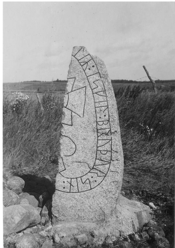
Plansch 93a. 283. Äldsta Vadstenvägen, S:ta Ingrids kloster, Skenninge. Foto Nordén 1946. [Jansson skriver 1947: Duger.]