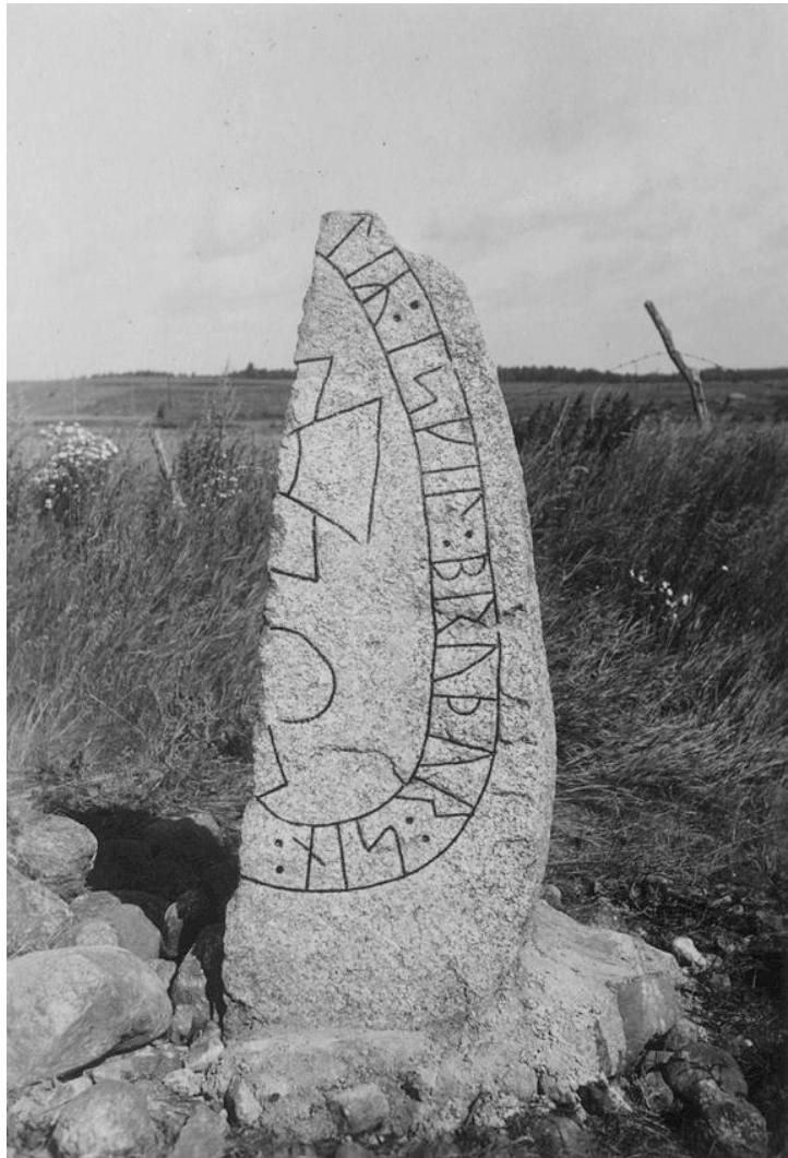
Plansch 93a. 283. Äldsta Vadstenvägen, S:ta Ingrids kloster, Skenninge. Foto Nordén 1946. [Jansson skriver 1947: Duger.]