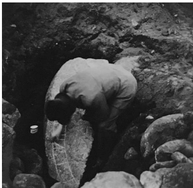
Fig. 182. 283. Äldsta Vadstena-vägen, S:ta Ingrid's kloster, Skänninge. Foto B. Cnattingius 1937 (Östergötlands museum). Runstenen i krita av T. Lindell.