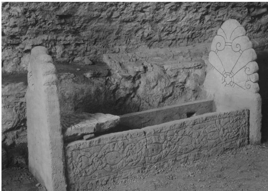
Plansch 92a. 279 och 280. S:t Martins kyrka, nu S:ta Ingrids kloster, Skenninge.

Häll av ljusgrå kalksten med kraftigt relieferad ornering, l. 2,10 m., nuv. höjd över marken 0,42 m., det ornerade partiets h. 0,27 m. Utgör den helt bevarade sidohällen till en Eskilstunakista och insattes 1946 i den rekonstruerade kistan i S:ta Ingridsklostrets stensmuseum. 38 Hällen anträffades vid Berit Wallenbergs grävningar 1937–39 39 , men över de närmare omständigheterna känner jag intet.