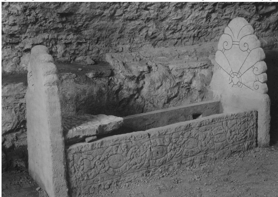
Plansch 92a. 279 och 280. S:t Martins kyrka, nu S:ta Ingrids kloster, Skenninge.

Häll av ljusgrå kalksten med kraftigt relieferad ornering, l. 2,10 m., nuv. höjd över marken 0,42 m., det ornerade partiets h. 0,27 m. Utgör den helt bevarade sidohällen till en Eskilstunakista och insattes 1946 i den rekonstruerade kistan i S:ta Ingridsklostrets stenmuseum. 39 Hällen anträffades vid Berit Wallenbergs grävningar 1937–39, 40 men över de närmare omständigheterna känner jag intet.