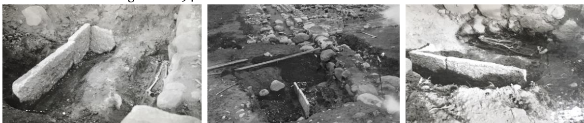
Fig. 176–178. 279. S:t Martins kyrka, nu S:ta Ingrids kloster, Skänninge. Efter foton 1929 F. Nibbelblad (176, från väster, graven undersökt), (177, södra korsgången med hällen i förgrunden), (178, hällen från ONO), dnr 4938/29 (ATA), fotona även i Östergötlands museum.