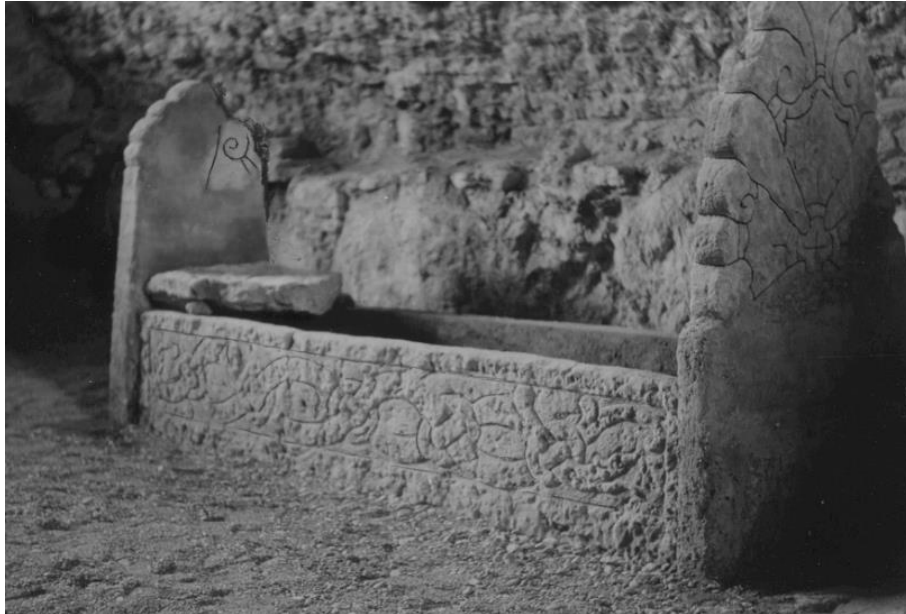
Plansch 92b. 279 och 280. S:t Martins kyrka, nu S:ta Ingrids kloster, Skenninge. Foto 1946 Nordén. [Jansson skriver 1947: Duger ej.]