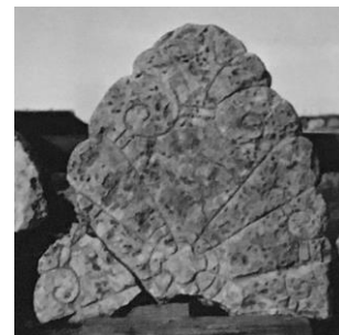
Fig. 179. 280. S:t Martins kyrka, nu S:ta Ingridis kloster, Skenninge.

Fragment av två gavelhällar till Eskilstunakista, av ljus gulaktig kalksten, det ena brottstycket 0,75 × 0,66 m., det andra 0,27 × 0,22 m. De äro exakt lika ornerade, men det mindre fragmentet utgör, efter dekorationsmönstrets anvisningar, icke en del av det större utan har ingått i kistans andra gavelhäll. 42 I enlighet härmed ha de insatts i en rekonstruktion av en sådan Eskilstunakista i stenmuseet vid S:ta Ingridis kloster. Brottstyckena äro lika ornerade på fram- och baksidorna. De bära icke någon runinskrift. 43