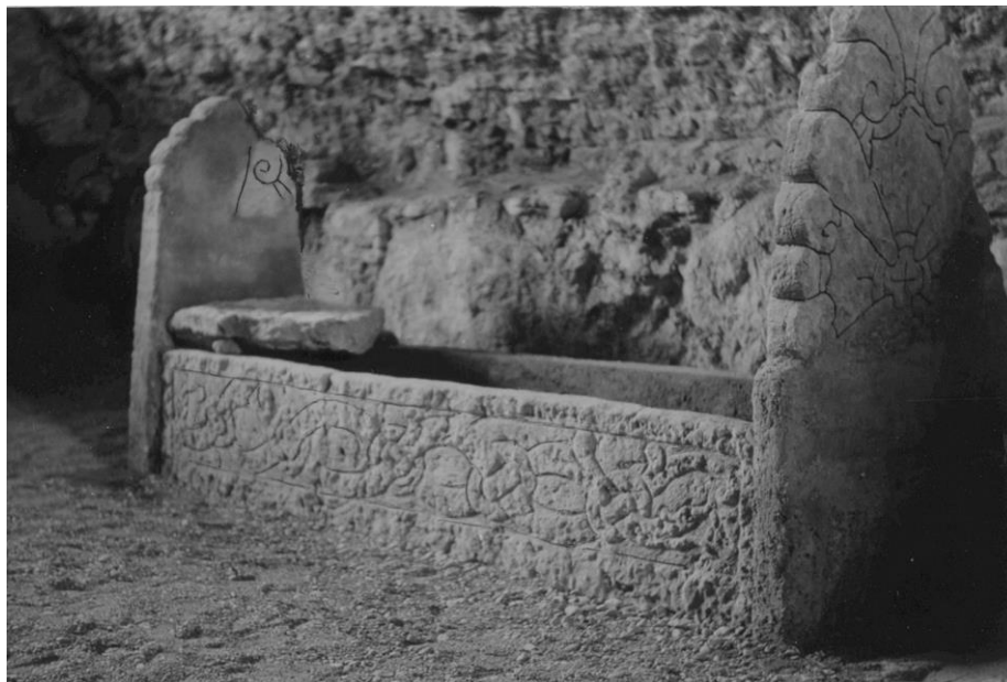
Plansch 92b. 279 och 280. S:t Martins kyrka, nu S:ta Ingridis kloster, Skenninge. Foto 1946 Nordén. [Jansson skriver 1947: Duger ej.]