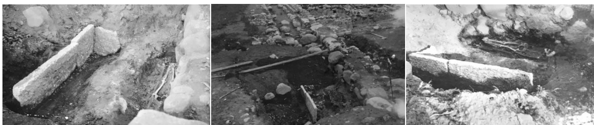
Fig. 176–178. 279. S:t Martins kyrka, nu S:ta Ingrids kloster, Skänninge. Efter foton 1929 B. Cnattingius (176, graven söder om hällen), F. Nibbelblad (177, södra korsgången med hällen i förgrunden), F. Nibbelblad (178, hällen från ONO), dnr 4938/29 (ATA).