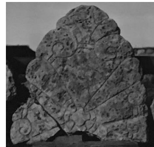
Fig. 179. 280. S:t Martins kyrka, nu S:ta Ingrids kloster, Skänninge.

Fragment av två gavelhällar till Eskilstunakista, av ljus gulaktig kalksten, det ena brottstycket 0,75 × 0,66 m., det andra 0,27 × 0,22 m. De äro exakt lika ornerade, men det mindre fragmentet utgör, efter dekorationsmönstrets anvisningar, icke en del av det större utan har ingått i kistans andra gavelhäll. 41 I enlighet härmed ha de insatts i en rekonstruktion av en sådan Eskilstunakista i stenmuseet vid S:ta Ingrids kloster. Brottstyckena äro lika ornerade på fram- och baksidorna. De bära icke någon runinskrift. 42