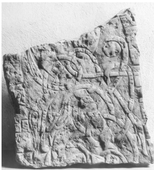
Fig. 174. 276. S:t Martins kyrka, nu S:ta Ingrids kloster, Skänninge. Foto A. Billow 1919 (ATA).