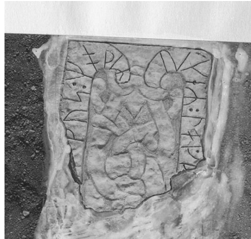
Plansch 90a. 275. S:t Martins kyrka, nu S:ta Ingrids kloster, Skenninge. [Vid planschen står »Frilägges». Jansson skriver 1947 om plansch 90a och 90b: Retuscherade. Duger ej.]