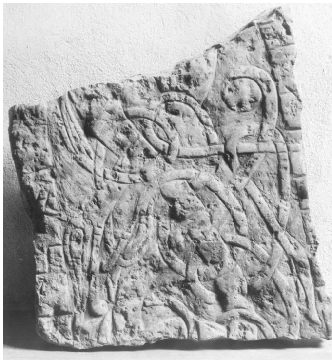
Fig. 174. 276. S:t Martins kyrka, nu S:ta Ingrids kloster, Skänninge.