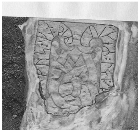
Plansch 90a. 275. S:t Martins kyrka, nu S:ta Ingridis kloster, Skenninge. Foto Nordén 1946 (ATA). [Vid planschen står »Frilägges». Jansson skriver 1947 om plansch 90a och 90b: Retuscherade. Duger