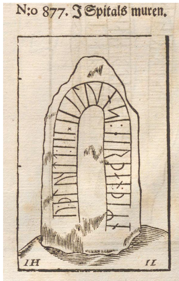
Fig. 171. Ög 168. Hospitalet, Skänninge. Efter B 877.