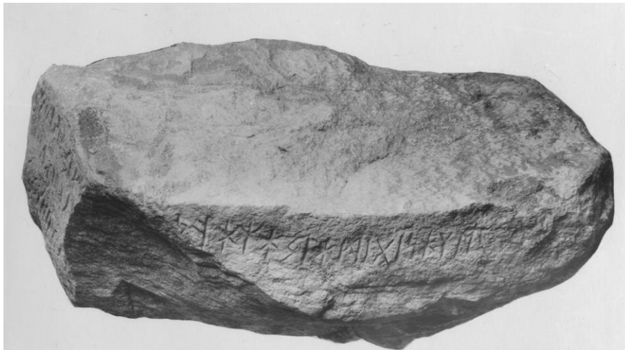
Plansch 60b. 269. Patergärdet invid Söderköping, Drothems sn – »Söderköpingsstenen». Smalsidans inskrift. Foto H. Faith-Ell 1936. [Jansson skriver 1947: Obs! Retusch för att verka ouppmålad.]

Söderköpingsstenen måste alltså tillhöra en tid avsevärt äldre än 600-talet.