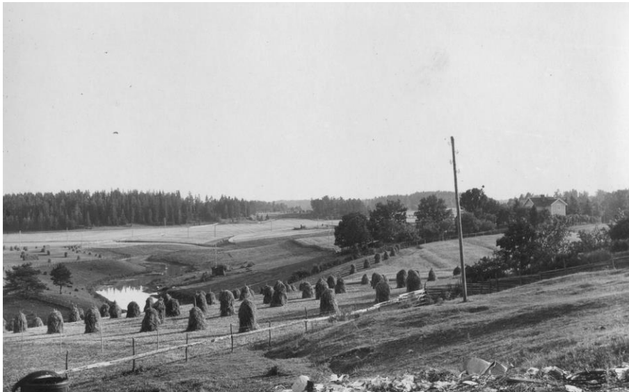
Plansch 62b. 269. Patergärdet invid Söderköping, Drothems sn – »Söderköpingsstenen». Storåns dalgång sedd mot väster från gården. Runstenens fyndplats är belägen under träden strax t.h. om telefonstolpen.