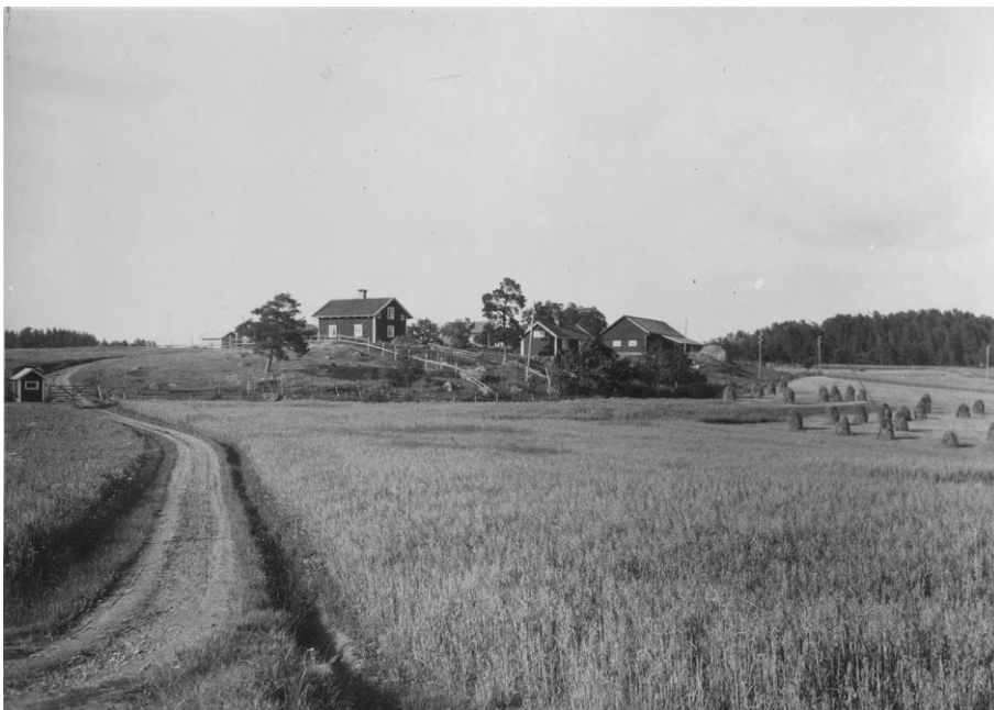
Plansch 62a. 269. Patergärdet invid Söderköping, Drothems sn – »Söderköpingsstenen». Gården sedd från SV. Fyndstället i diket under träden nedanför lillstugan.