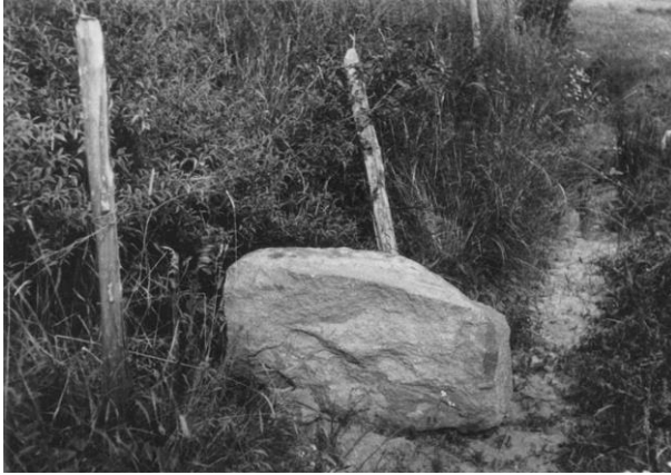
Fig. 110. 269. Patergårdet invid Söderköping, Drothems sn – »Söderköpingsstenen». Runstenen i dess läge i diket. 1936.