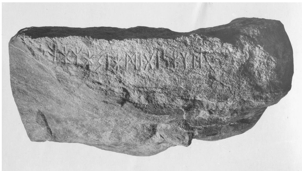
Plansch 61c. 269. Patergärdet invid Söderköping, Drothems sn – »Söderköpingsstenen». Stenens smalsida med inskriftraden A.

Släppans brottkant skär igenom nedre delen av runan 15 s , och från denna punkt torde inskriftens närmaste parti för all framtid vara förlorat, då släppan i denna kant utgjorts av en tunn skålla av stenens yta, som här brustit mycket ojämnt. Även om släppan skulle återfinnas, kan man inte vänta, att denna del skall vara bevarad. Av runan 15 är hela övre delen och runans sneda tvärstreck samt ungefär hälften av nedre delen bevarade, samtliga delar lika djupt huggna som stenens övriga runor, och någon tvekan om dess s -karaktär kan ej uppstå. För en restitution av de närmast 15 s följande runorna har man f. n. ingen annan ledning än den, som möjligen – antagandet göres här med all reservation – lämnas av tvenne svagt urskönjbara knackspår å fragmentariskt kvarstående fläckar av den äldre svårt vittrade eller bortflagrade ytan. Det ena är ett obetydligt, ojämnt fördjupat ställe 2 cm från s -runans vänstra och övre skänkel, överdelen befinner sig visserligen något under runans övre ansättningspunkt, men trots allt är det icke otänkbart, att vi här ha vittringsspåren från skåran i en nu försvunnen runas överände. Därefter följer ett utvittrat parti, som åt vänster begränsas av en liten snett löpande valk. I denna valk kvarstår på ett ställe 3,3 cm från sist beskrivna ristningsspår, ett mjukt rundat hack av obetydlig utsträckning, som kunde vara en antydning om, var runan nr 17 (eller ev. runan 18) varit ansatt.