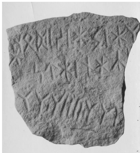
Plansch 61b. 269. Patergärdet invid Söderköping, Drothems sn – »Söderköpingsstenen». Gipsavgjutning av toppytans inskrift, positiv form.

blekingska runstensgrupp hörande Björketorp- och Istabystenarna är rättvänd. Hur litet konsekventa »övergångstidens» runmästare voro vid valet av runtyper får man en erinran om, då man ser Sten-toftenristaren på ena raden skriva niuha och omedelbart därunder niuha . Märk: i samma ord, bägge börjande sin rad och placerade direkt ovan- resp. nedanför varandra.