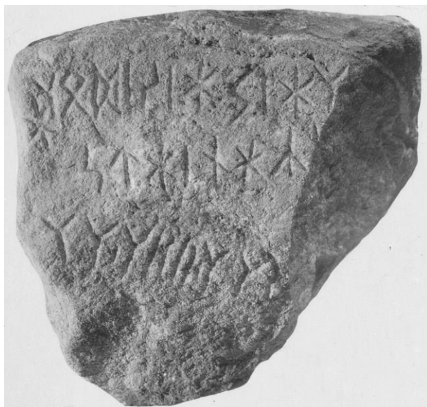
Plansch 61a. 269. Patergärdet invid Söderköping, Drothems sn – »Söderköpingsstenen». Direktfoto av toppytans inskrift. Foto H. Faith Ell 1936.