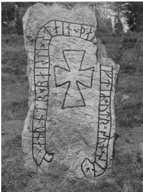
Plansch 12a. Ög 26. Öster Skam, Östra Ny sn. 1942. [Retuscherad.]

Nordenskjöld uppger i sin berättelse om socknen 1870–1, tr. i Meddelanden 1929–30, att » Stenens nuvarande lutning har uppkommit till följd af den vid foten befintliga gropen , gräfd af en resande västgöte (Redlund), som trodde sig här kunna finna skatter; arbetet blef dock ofullbordadt, sedan han derunder blifvit sjuk.»