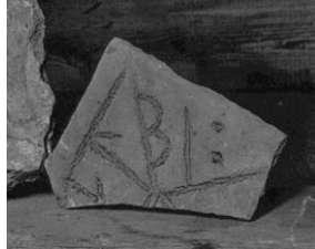
Plansch 28c. 257. Herrestads kyrka. Foto Otto Janse 1903 (ATA). [Vid fotot, jämte nr 256 och 258, står »Bilder senare i höst!» Vilket även Jansson noterat 1947.]

Hörnstycket av en kalkstenshäll med runorna albi :, »hjelpe!» avbildades av Janse år 1903, då det förvarades i tornrummet. 42