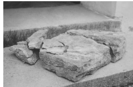
Fig. 92. 295. Hovs kyrka. Stenen före ihopsättning. Foto G. Olson 1947 (ATA).