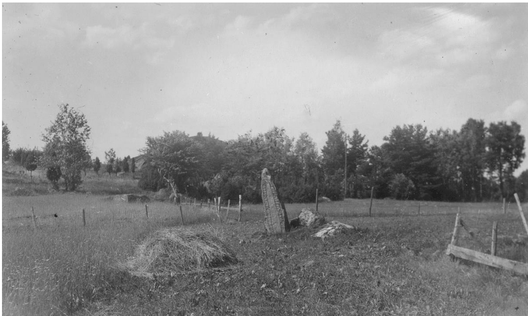
Plansch 120b. Ög 219. Lundby, Lillkyrka sn. Foto Nordén 1941.