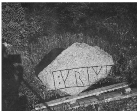
Plansch 57a. Ög 216. Sunds Södergård, Sunds sn. Vid planschen står »Frigöres!» [Jansson skriver 1947: väl liten (beskäres)].

Till läsningen: Brates tanke, att det skulle ha funnits en »fotslinga», finner jag obefogad. Stenen slutar rund och naturlig, utan spår av brottkant t.v. om linjen framför kolonet i början och Brates utdragna övre slinglinje torde knappast låta spåra sig. Inskriften inledes med två djupa punkter efter en tvärställd linje, som kan vara ett i men snarare verkar att vara slingans begränsningslinje. R. 2 r börjar ett par tre cm. nedanför radlinjen. 3 i är tydligt. R. 4 har en bst till vänster om hst, som är lika tydlig som den t.h., varför runan måste ha varit m. R. 5 har sin hst avskuren strax nedom mitten av brottet i stenkanten. Av bistavar synas inga säkra spår, och tänkbart är knappast, att sådana bistavar funnits, då ju en god del av ytan t.h. upptill om hst är bevarad. Helst ville man därför uppfatta runan såsom ett i.