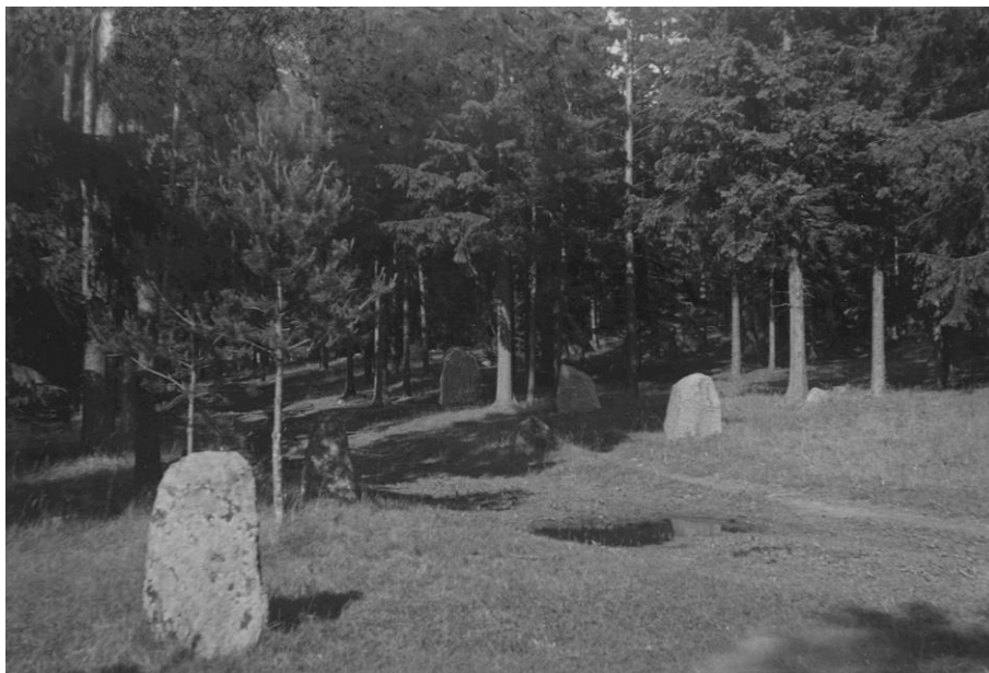
Plansch 115a. Ög 210. Kårarp, Viby sn. Foto Nordén 1946. [Retuscherad]