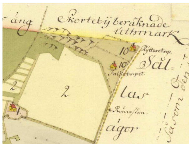
Fig. 220. Ög 210. Kårarp, Viby sn. Detalj ur Embrings karta över Kårarp upprättad 1734, i Lantmäteristyrelsens arkiv.