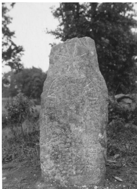
Fig. 221. Ög 211. Mörby, Viby sn. Foto B. Cnattingius 1929, dnr 4123/29 (ATA).