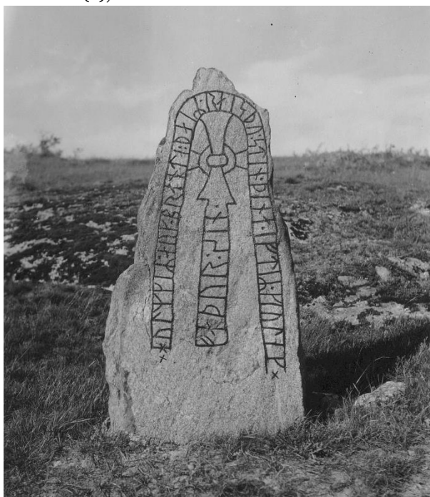
Plansch 10a. Ög 20. Hjärtrum, »Söverstad välting», Kuddby sn. Foto Nordén 1941. [Retuscherad. Jansson skriver 1947: Kan ej användas.]

Till läsningen: R. 44, som är av betydelse för uppfattningen av den dödes namn, är icke entydig. Hadorph läser i, Brate har å sin bild ett klart i, utan antydning av någon ojämnhet i ytan omkring runan, men läser i texten runan som a , stödd av den omständigheten, att det på hst »finnes ett gropigt kännestreck», som Brate uppger sitta ungefär lika högt som det på 13 a . Själv är jag emellertid mycket tveksam, huruvida den obetydliga urgröpfung t.v. om huvudstaven, på vilken Brate stöder sin läsning av runan som a , verkligen kan tilldelas värdet av bst. Runan skulle med en sådan bst avvika från formen på ristningens andra a -runor. För egen del — och jag har härvid fått instämmande av Sven B. F. Jansson, som granskat ristningen år 1946 23 — finner jag riktigast återge runan som i, och jag ser därför i mansnamnet en skrivning för Giuleikr . Skulle emellertid runan vara att utläsa som a , har man att räkna med ett mansnamn Kiulakr , som är belagt på ett par, möjligen tre uppländska runstenar (U 42,