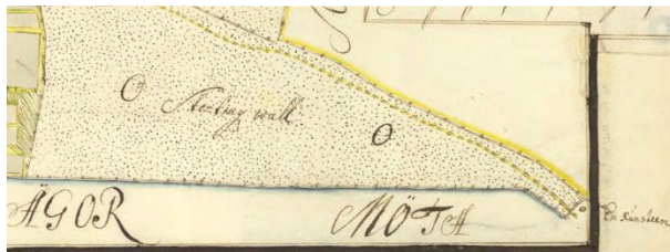
Fig. 25a. Ög 20. Hjärtrum, »Söverstad vältning», Kuddby sn. Detalj ur A. Ahlgrens karta för Hjärtrum upprättad 1704, i Lantmäteristyrelsens arkiv.