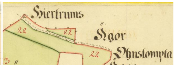
Fig. 25b. Ög 20. Hjärtrum, »Söverstad vältning», Kuddby sn. Detalj ur A. Nilssons karta för Harsby, Å sn upprättad 1692, i Lantmäteristyrelsens arkiv.