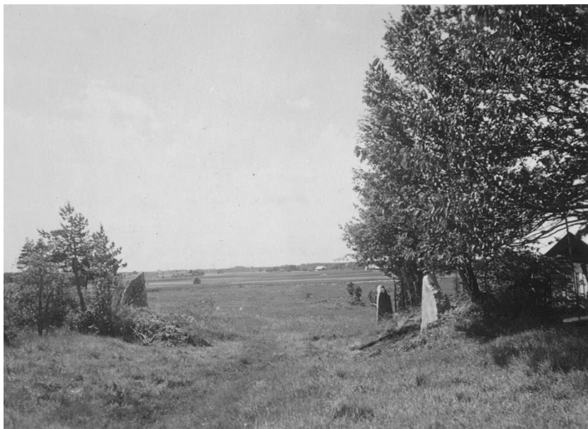
Plansch 114b. Ög 207, Ög 209, Ög 208. Enebacken, Kårarps ägor, Viby sn. Foto Nordén 1946.