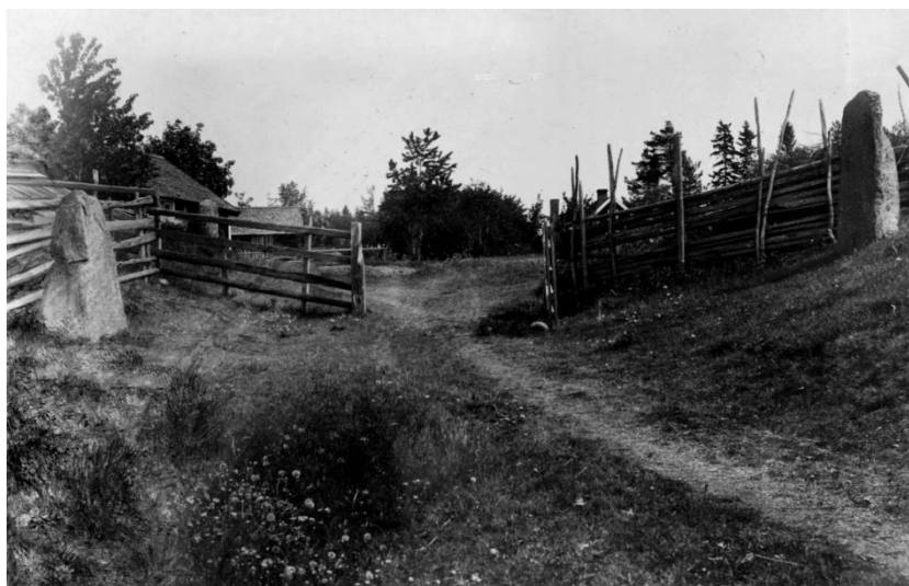
Fig. 217. Ög 209, Ög 208, Ög 207. Enebacken, Kårarps ägor, Viby sn. Foto E. Sörling 1919 (ATA).