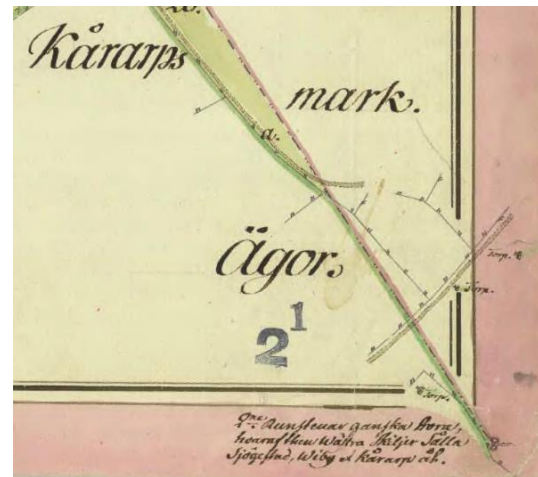
Fig. 215. Ög 207, Ög 208. Enebacken, Kårarps ägor, Viby sn. Detalj ur Ekmansons karta över Slätkärrret upprättad 1792—95, i Lantmäteristyrelsens arkiv.