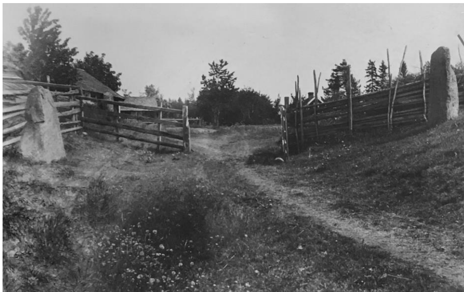
Fig. 219. Ög 209, Ög 208, Ög 207. Enebacken, Kårarps ägor, Viby sn. Foto E. Sörling 1918 (ATA).