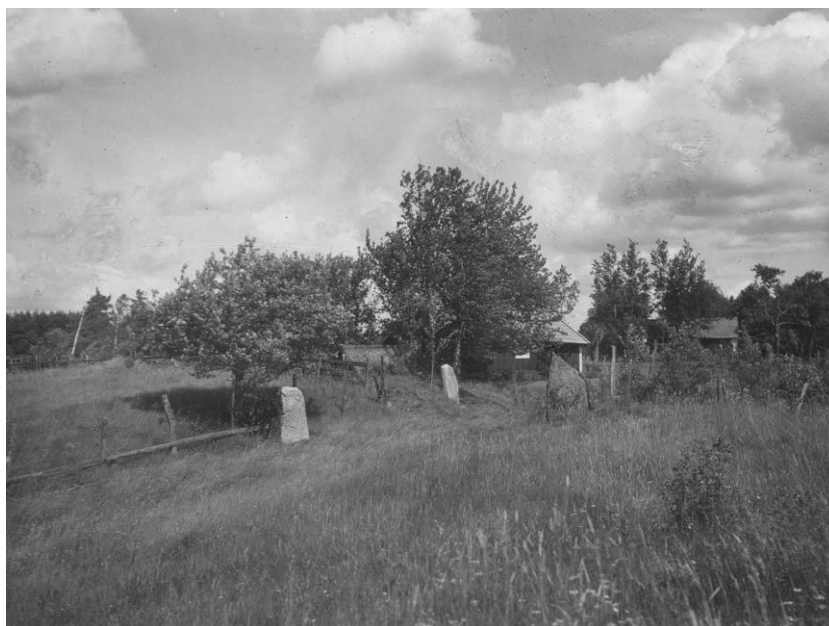
Plansch 114a. Ög 209, Ög 208, Ög 207. Enebacken, Kårarps ägor, Viby sn. Foto Nordén 1946.

För den händelse ristningens sista del varit butaipikan , vore man berättigad att häri se ett bonda idigan , med det i äldre nusvenska och i danska och norska dialekter förekommande adjektivet idig , motsvarande vårt idog . 59