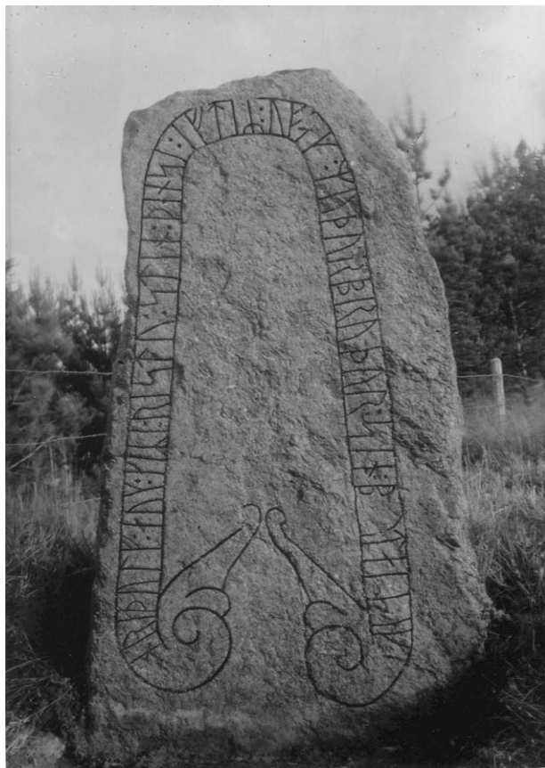
Plansch 116a. Ög 207. Enebacken, Kårarps ägor, Viby sn. Foto Nordén 1946. [Jansson skriver 1947: Ret. Dålig bild]

sidan av hst i r . 36 finns en djup skåra, genom vilken bst:s högra del kan ha passerat. R . 37 har en fin punkt, som möjligen är huggen. R . 38—55: läsningen vållar inga svårigheter, ehuru ytan ställvis är illa vittrad. Därefter följer ett svårt skadat parti, som på teckningen i Bautil lämnas helt blankt och som av Brate lästs och tolkats på ett föga nöjaktigt sätt. Snarast vill man förklara det så, att han icke tillräckligt rengjort ytan här. Runorna 56—59 äro nämligen, på r . 57 när, fullt tydligt huggna och kunna icke avge Brates ku(pa)n . Omedelbart efter 55 a (alltså utan kolon emellan, som hos Brate) följer en i -runa (så också hos Brate; ifyllningen å Brates bild motsvarar även i det följande icke hans utsago i texten). Därefter följer ett skrovligt parti utan spår av runlinjer, varpå kommer en tydligt huggen hst, till vilken synes kunna höra en skåra förlagd bst som till en p -runa. R . 58 är ett tydligt i , r . 59 ett k , vars bst till större delen ligger i en spricka. Efter denna runa synes liksom 58 övre delen av en hst och fragment av bst till en a -runa. Uteslutet