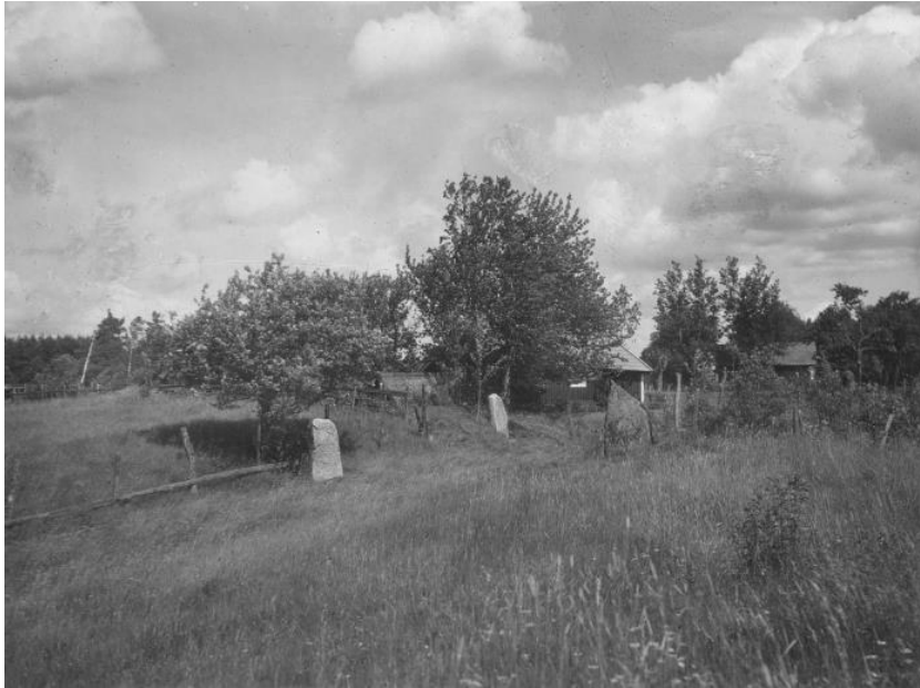
Plansch 114a. Ög 209, Ög 208, Ög 207. Enebacken, Kårarps ägor, Viby sn. Foto Nordén 1946.

För den händelse ristningens sista del varit butaipikan , vore man berättigad att häri se ett bonda idigan , med det i äldre nusvenska och i danska och norska dialekter förekommande adjektivet idig , motsvarande vårt idog . 58