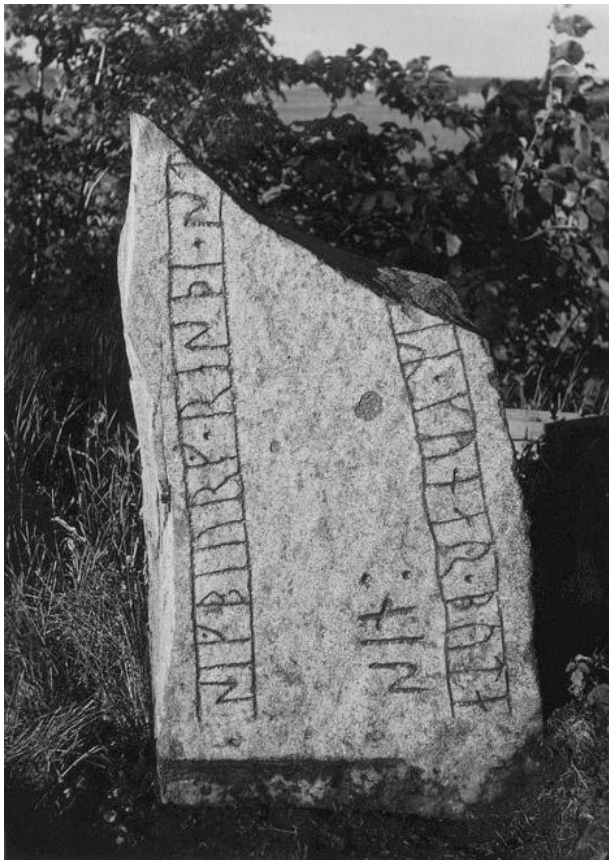
Plansch 113a. Ög 205. Viby kyrkogård. Foto Nordén 1946. [Jansson skriver 1947: Efter bearbetning användbar.]

Namnet Sigborg är ovanligt 48 på fornsvenskt område. En svenska Sigrbiorg d. Þorgnyrs logmannz omtalas dock i den isländska Flatöboken. Synbarligen är namnet identiskt med det sihborh , som förekommer på den uppländska runstenen U 595 Hargs skog (den östgötska förekomsten har förbisetts vid formuleringen av omdömet å s. 499 nederst i Sveriges runinskrifter VII ).