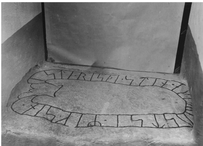
Plansch 109b. Ög 204. Viby kyrka. Foto Nordén 1946.

[Jansson skriver 1947: Retusch. Duger ej.]