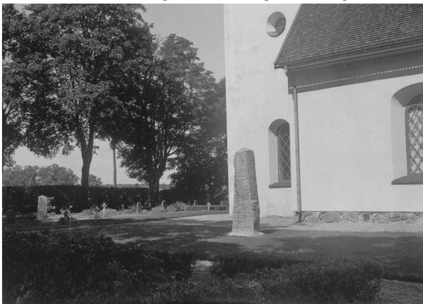
Plansch 107b. Ög 200. Uddarp, Sya sn. Nu vid kyrkan. Foto Nordén 1946. [Jansson skriver 1947: Endast översiktsbild.]

Den hårda medfart, som stenen varit utsatt för genom människors ingrepp, har samverkat med en stark vittring, som på stora delar av framsidan nästan helt utplånat radlinjer och runor, så att stenen nu är ytterligt svårläst. Detta är mycket att beklaga, då stenen till hela sin stil framstår såsom ett av landskapets äldre runminnesmärken från den svensk-danska runradens tid: uppradandet av runorna i vertikalt ställda kolumner med ett horisontalt begränsningsstreck nedtill påminner om Rökstens-tidens 22 inskrifter, m -runan är av den i särskilt denna del av Östergötland förekommande typen med bistavarna hopböjda till en cirkel, skriften löper på två sidor, kanske har den funnits även på den bort-huggna tredje sidan, allt drag som ställa stenen vid sidan av en del runminnesmärken av äldre typ. Påfallande är likheten med Ög 98 Strålsnäs, Ög 193 Härberga.