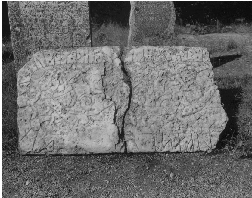
Plansch 1a. Ög 2. Orlunda kyrka. Foto Nordén 1946. [Vid planschen står: »Frilägges. Runstenen + vitt fält = l. 15,5». Jansson skriver 1947: Retuscherad. Målas om. Oduglig.]

Om namnet Vīfastr , se E. Wessén, Nordiska namnstudier , s. 101.