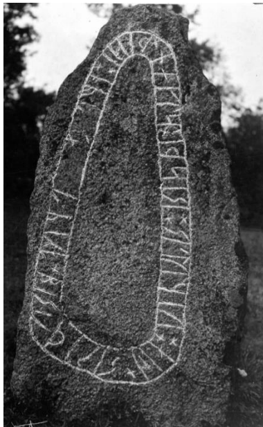
Fig. 210. Ög 197. Sörby kyrka, Mjölby. Foto F. Nibbelblad 1928 (ATA)

Till läsningen: Efter 37 r finnas antydningar efter ett övre kryss, i 25 r finnas svaga antydningar även av runans högra del, varför jag ifyllt denna.