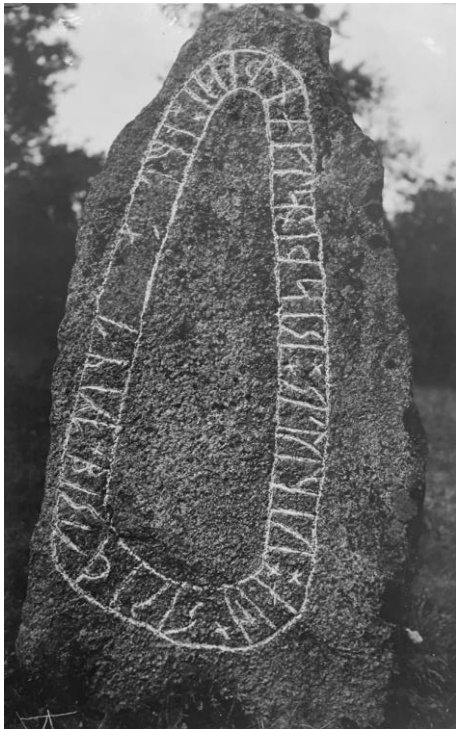
Fig. 212. Ög 197. Sörby kyrka, Mjölby.

Till läsningen: Efter 37 r finnas antydningar efter ett övre kryss, i 25 r finnas svaga antydningar även av runans högra del, varför jag ifyllt denna.