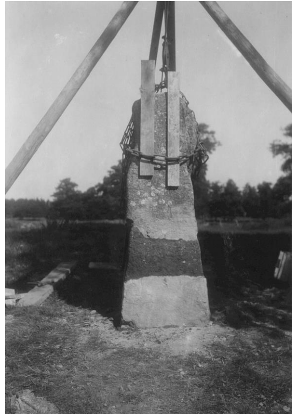
Fig. 210. Ög 190. Nybble ägor, Vikingstads sn. Foto G. Olson 1937. Runstenen på sin nya plats.