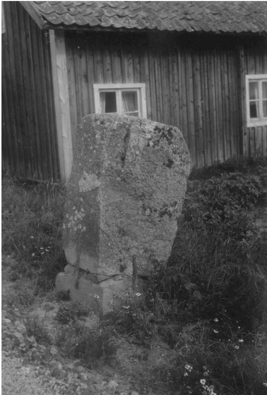
Fig. 209. Ög 190. Nybble ägor, Vikingstads sn. Foto G. Olson 1937. Runstenen före flytten.