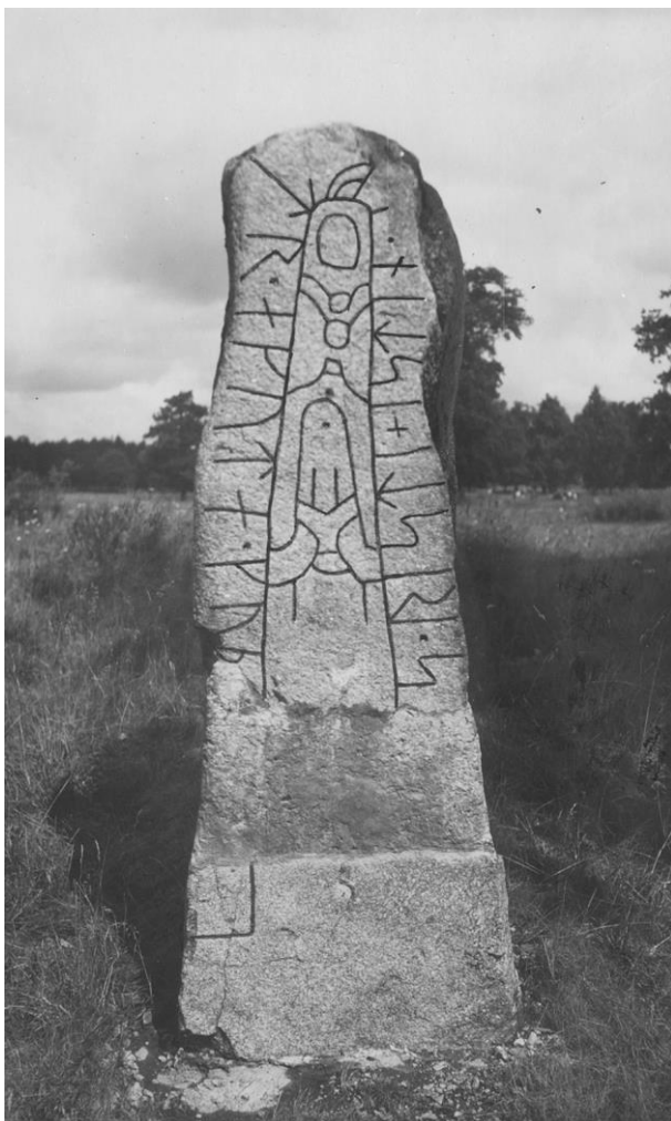
Plansch 105b. Ög 190. Nybble ägor, Vikingstads sn. Foto Nordén 1945. [Vid bilden står: »bakgrunden lättas upp vid klicheringen» Jansson skriver 1947: Helt retusch]