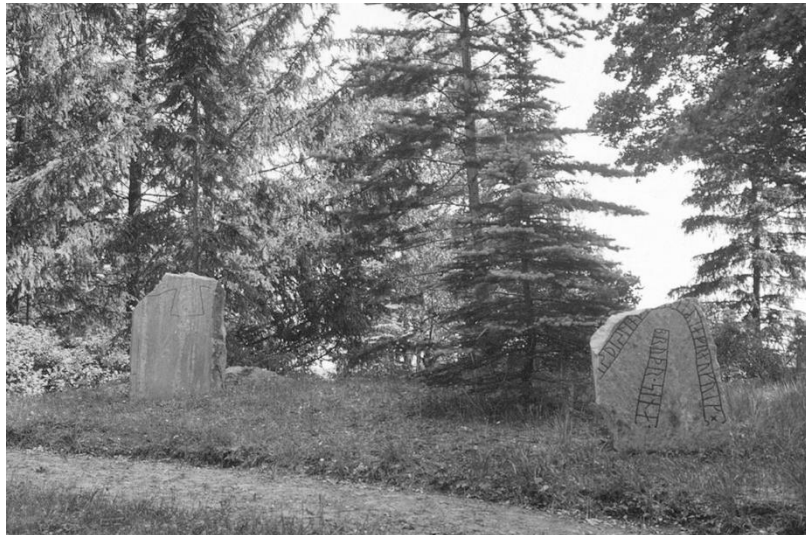
Fig. 23. Ög 19 och Ög 18. Kuddby kyrka. Foto A. Nordén 1942 (ATA).