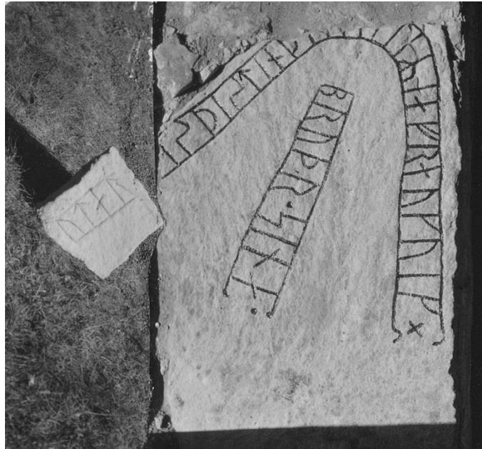
Plansch 8a. Ög 18. Kuddby kyrka. Fotomontage av Nordéns foto 1941 och G. Olsons foto 1947. Runstenen infälld i ena tornluggens fönsterbotten. [Vid planschen anges: »Runstenen med den tillskarvade biten frigöres!«. Jansson skriver 1947: Kuddby. Fotograferas om]