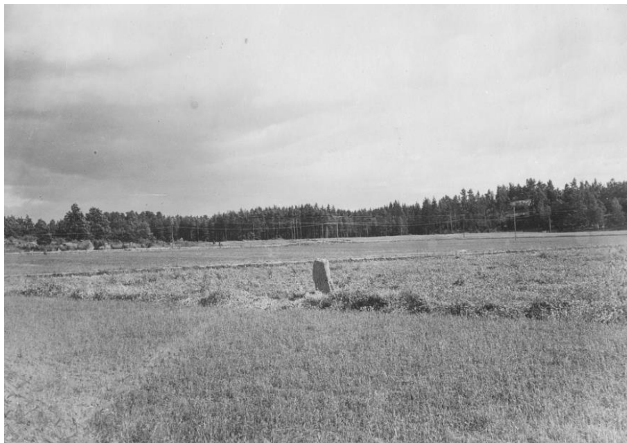
Plansch 102b. Ög 189. Bo, Vikingstads sn. 1945. [Jansson skriver 1947: Översiktsbild duger]