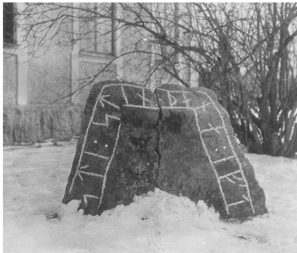
Fig. 206. Ög 187. Hackstad, nu vid Lunnevad, Sjögestads sn. Foto Per Söderbäck 1931, dnr 1277/31 (ATA).