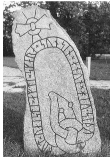
Fig. 204. Ög 186. Frackstad, nu vid Lunnevad, Sjögestads sn. Se sid. XI i inledningen. 1943, dnr 2080/46.

Plansch 104a. Ög 186. Frackstad, nu vid Lunnevad, Sjögestads sn. 1945. [Jansson skriver 1947: Kraft. retusch]