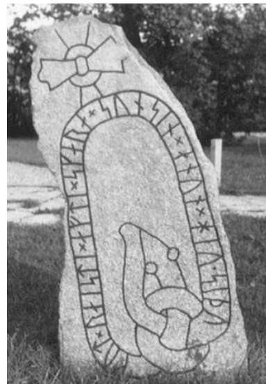
Fig. 203. Ög 186. Frackstad, nu vid Lunnevad, Sjögestads sn. Se sid. XI i inledningen. 1943, dnr 2080/46..

Plansch 104a. Ög 186. Frackstad, nu vid Lunnevad, Sjögestads sn. 1945. [Jansson skriver 1947: Kraft. retusch]