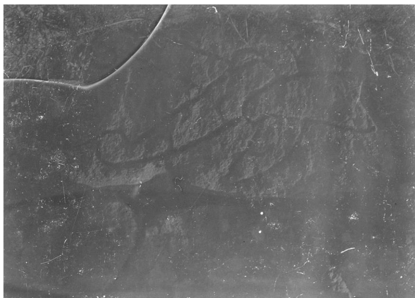
Fig. 202. Ög 185, Sjögestads kyrkogård.

Det av Nordenskjöld år 1870 upptäckta runstensfragmentet i södra kyrkogårdsmuren 2,5 m. väster om ingången genom muren rasade jämte en del av muren ner i ett schakt för en ledning, som i början av 1930-talet drogs fram invid muren här. Ristningen utgjordes av ett par konstfullt sammanflätade slinggärdar utan runor, och det var förklarligt, att ingen tog notis om den försvunna stenen. Den döljes alltjämt i schaktet och torde kunna upphämtas ur detta. 28