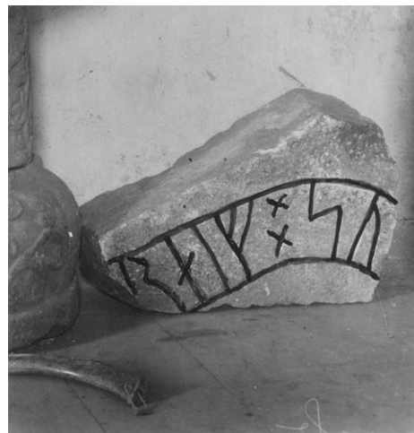
Plansch 96c. Ög 175. Skärkinds gamla kyrka. Foto Nordén 1936. [Jansson skriver 1947 om bilderna till planschen: Helt retuscherade.]