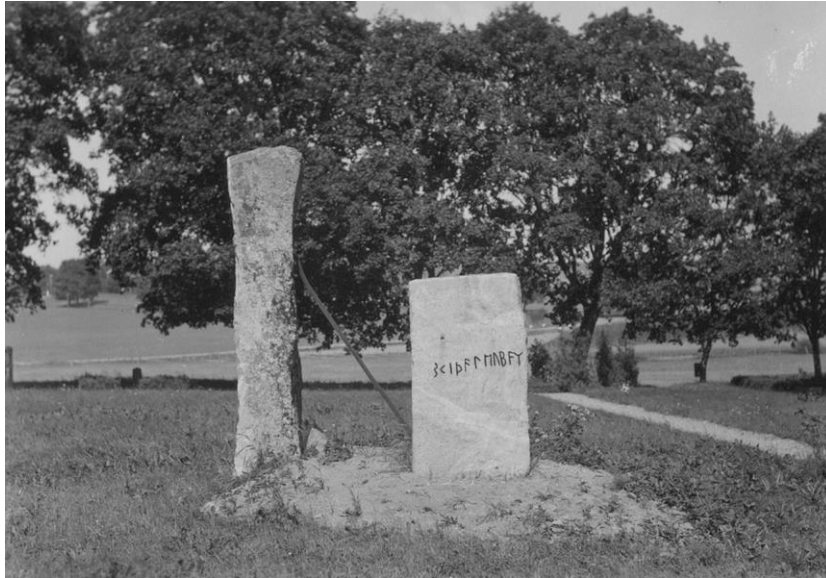
Plansch 94b. Ög 172 och Ög 171. Skärkinds gamla kyrka. Foto Nordén 1941. [Jansson skriver 1947: Kan användas om det förstoras om.]