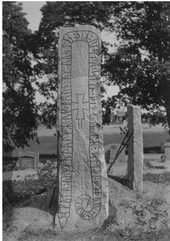
Plansch 95b. Ög 172. Skärkinds gamla kyrka. Foto Nordén 1941.