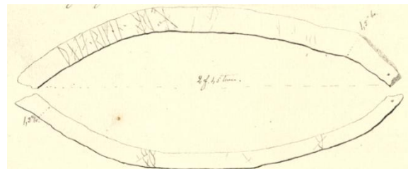
Fig. 186. Ög 173. Skärkinds gamla kyrka. Teckning C. F. Nordenskjöld, reseberättelse 1876 (ATA)

Genom ett borrat hål i benets ena ände har sannolikt dragits en tråd, som sammanhållit benet med ett eller flera andra.