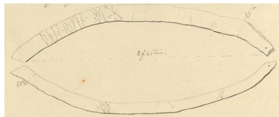
Fig. 186. Ög 173. Skärkinds gamla kyrka. Teckning C. F. Nordenskjöld, reseberättelse 1876 (ATA).

Genom ett borrarat hål i benets ena ände har sannolikt dragits en tråd, som sammanhållit benet med ett eller flera andra.