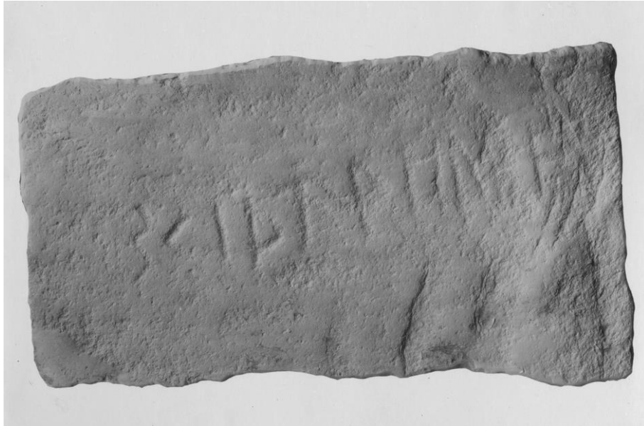
Plansch 96a. Ög 171. Skärkinds gamla kyrka. Gipsavgjutning av inskriften å Skärkindsstenen, positiv form, utförd 1936 av Nordén. Foto N. Lagergren 1936 (StHM). [Vid plansen skriver Wessén: Är det bästa foto som kan åstadkommas? Värdefullt att få en sådan bild, och man bör göra stora ansträngningar, både i fråga om avgjutningen och fotograferingen. Kanske man t.o.m. bör ta med en bild med ifyllning?]

Ett i sammansättning stående urn. substantiv skīpa synes icke kunna vara någonting annat än stamform av det ord, som föreligger i fvn. skíð , n., 'det ena av de stycken, vari en trädstam klyves', med en likbetydande svag biform skíði . 10 Fsv. har skīþ , n., i samma betydelse. Förleden i namnet * Skiða-Leubar erinrar alltså om den 11 i fvn. skíðafang , 'så mycket bränsle som man kan bära i famnen', och runordet borde därför kunna förstås som 'skid- Leubar ', d.v.s. ungefär Leubar med stock-bräderna'. Möjligen kunde man tänka sig det som sammansatt av det svaga skíði genitiv med assimilerat n, alltså skíða(n)-Leubar . Men för en så gammal sten som Skärkindsstenen är antagandet kanske något betänkligt. 12