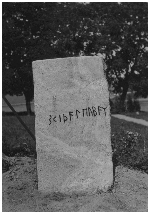
Plansch 95a. Ög 171. Skärkinds gamla kyrka. Foto Nordén 1941.

Om alltså gårdsnamnet Skinnstad i Skärkinds sn ej av särskilt tvingande skäl anses böra sammanhållas med personnamnet å Skärkindsstenen, finnes ej längre något behov att utläsa detta som *Skinþa-Leubar , med supplerat -n- framför þ . På stenen står ju blott skīpa som förled i sammansättningen, och man synes mig i första hand böra pröva möjligheten att tolka detta som det står, innan man tillgriper utvägen att supplerat n 'et. I en så avlägsen del av runskriftstiden, som det här rör sig om, är uteslutningen av nasalerna någonting ganska ovanligt.