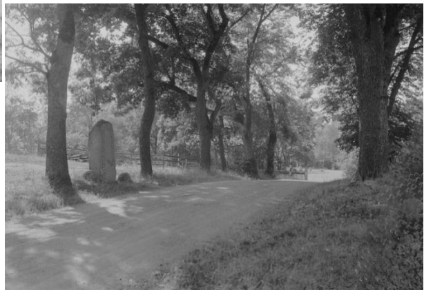
Plansch 94a. Ög 170. Åkerby (föret Ösby), Gårdeby sn. Foto Nordén 1941. [Jansson skriver 1947: Översiktsbild duger.]