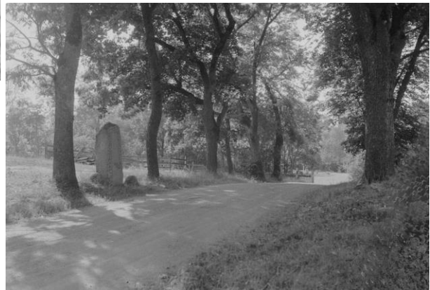
Plansch 94a. Ög 170. Åkerby (föret Ösby), Gårdeby sn. Foto Nordén 1941. [Jansson skriver 1947: Översiktsbild duger.]