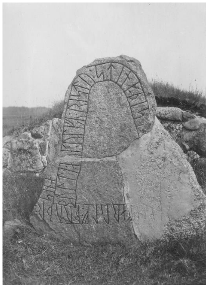
Plansch 86c. Ög 166. Hospitalet, Skenninge. 1946. [Jansson skriver 1947: Retuscherad. Duger.]