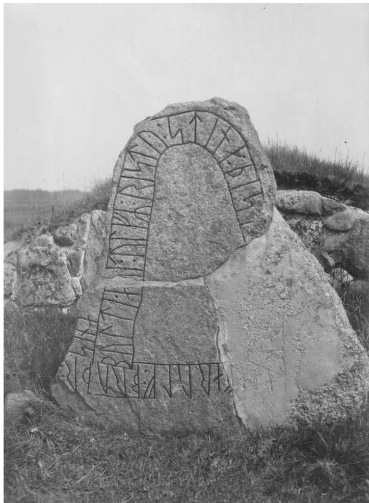
Plansch 86c. Ög 166. Hospitalet, Skenninge. Foto Nordén 1946. [Jansson skriver 1947: Retuscherad. Duger.]