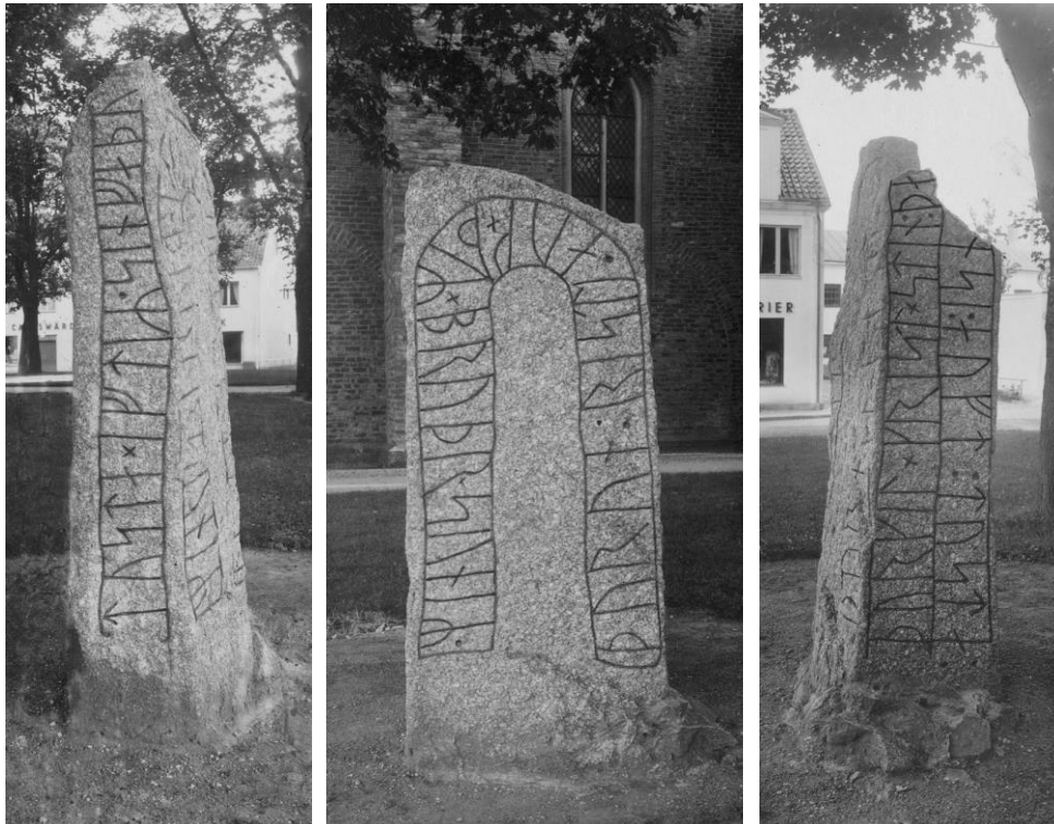
Plansch 87. Ög 165. Vårfrukyrkan, Skenninge. 1946. [Jansson skriver 1947 (om 87a): »Kraftigt retuscherad.» (om 87b): »Retuscher, duger» (om 87c): Kraftig retusch.]

Till läsningen: Wessén låter 5 n åtföljas av kryss, Brate och jag ha där sett en punkt. Märket är otydligt, vad som talar för punkt är, att nästa sk är en sådan. Mellan 39 och 40 har Brate en punkt, Wessén och jag räkna icke med något sk här, men ett svagt märke i stenen finnes verkligen. Framför 44 þ har Brate ett kryss, Wessén och jag räkna ej med ett sådant. Lika litet ha Wessén och jag kunnat finna något kryss framför 27 t som Brate däremot har utsatt.