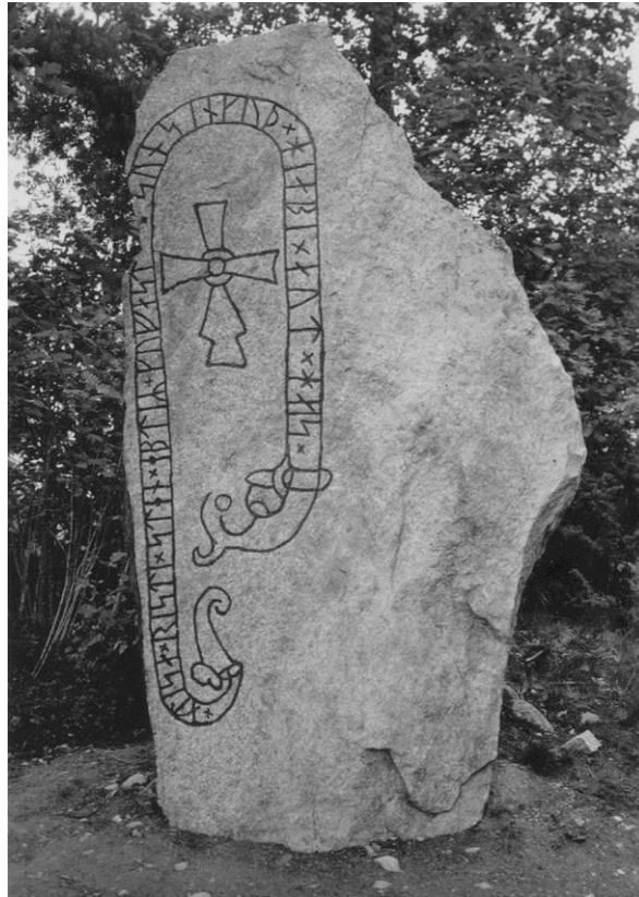
Plansch 85b. Ög 163. Skattna, Kullerstads sn. [Jansson skriver 1947: Retusch. Möjlig.]

Blocket, som är 3,20 m. långt och 1,44 m. brett, gör nu, sedan det återfått sin ursprungliga resning, ett mäktigt intryck. 12