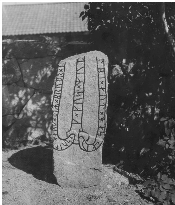
Plansch 85a. Ög 161. Kimstads kyrka. Foto Nordén 1941.

»Sven och hans bröder reste stenen efter sin fader Jarl. Gud och Guds moder hjälpe hans ande till ljuset!«