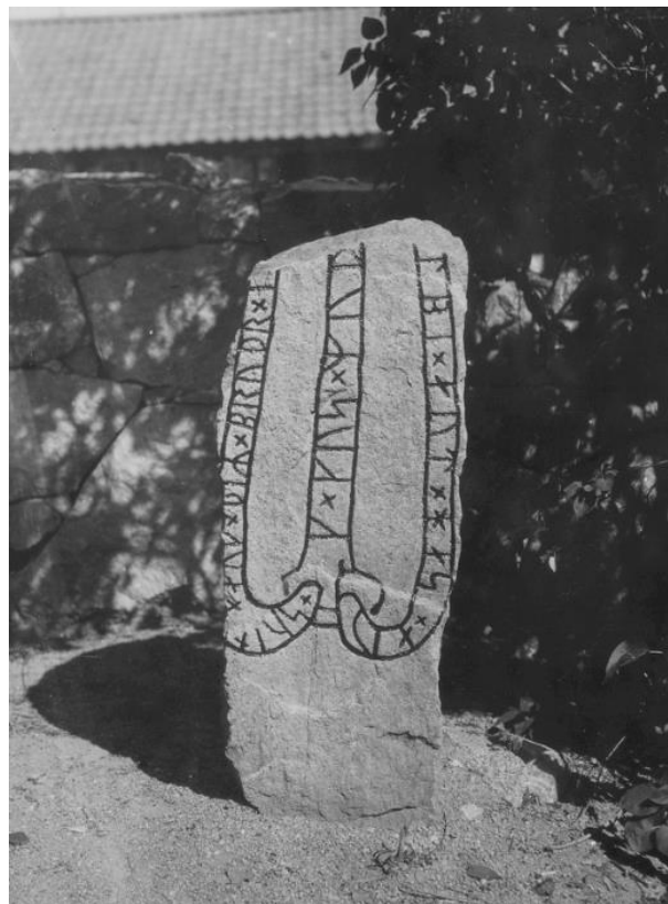
Plansch 85a. Ög 161. Kimstads kyrka. Foto Nordén 1941. [Jansson skriver 1947: Klumpigt målad. Fotografiskt är färgens bländande olämpligt.]

»Sven och hans bröder reste stenen efter sin fader Jarl. Gud och Guds moder hjälpe hans ande till ljuset!«