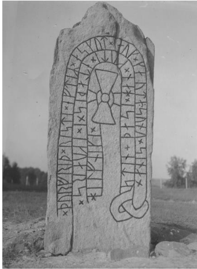
Plansch 82a. Ög 155. »Syltenstenen», Bjällbrunna ägor, Styrestads sn. Foto 1941 Nordén. [Jansson skriver 1947: Retusch endast fem runor.]