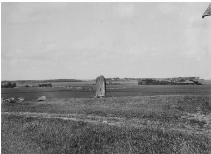
Plansch 81a. Ög 155. »Syltenstenen», Bjällbrunna ägor, Styrestads sn.

Till läsningen: 43, 44 Det sk, som ovan upptages efter 30 a , är möjligen blott naturliga gropar (B 857 har här ett kryss, Brate har intet sk).