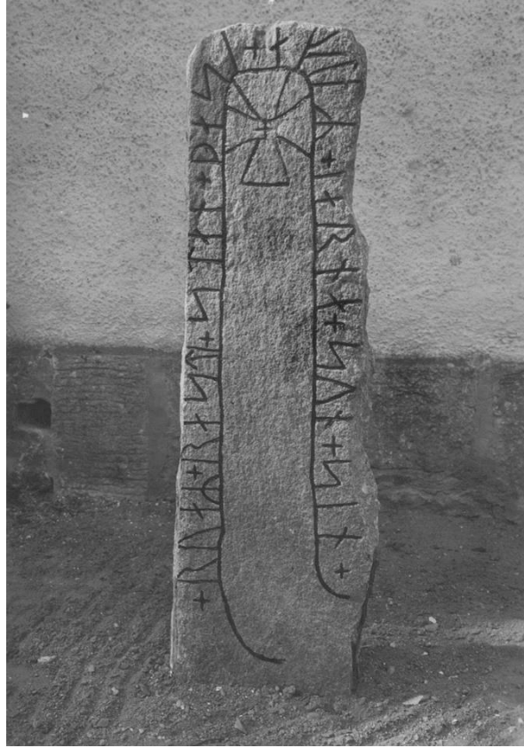
Plansch 7b. Ög 14. Konungssunds kyrka. Foto Nordén 1942. Vid planschen står »Hälles ljusare!» Jansson skriver 1947: 8 runor retuscherade rättade i > a