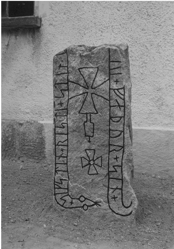
Plansch 7a. Ög 13. Konungssunds kyrka. Foto Nordén 1942. Vid planschen står »Ljusare» och »Bör kunna förstoras något? Åtminstone så mycket att stenens höjd blir lika med Ög 14. Bakgrunden bort på båda bilderna?» Jansson skriver 1947: 2 runor t och a kompletterade. Jfr ATA 8 retuscherade