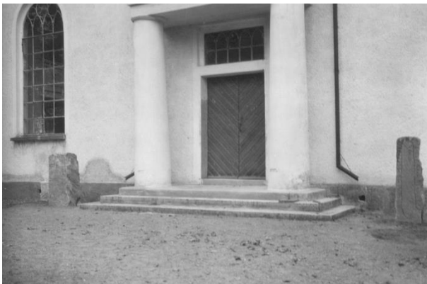
Fig. 18. Ög 13 och Ög 14. Konungssunds kyrka. Foto G. Olson 1941.

Om möjligheten att de två Konungssundsstenarna eller åtminstone Ög 13 ursprungligen varit resta nere vid landsvägsbron över Vadsbäcken se under Ög 29 och 30.