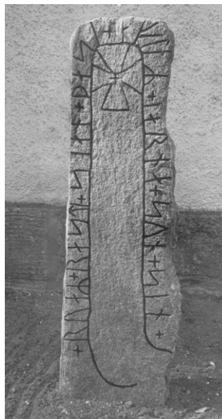
Fig. 20. Ög 14. Konungssunds kyrka. Oretuscherat.