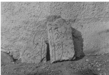
Fig. 15. Ög 12. Vårdsbergs kyrka. Original till Plansch 5b.