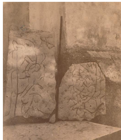
Fig. 16. Ög 12. Vårdsbergs kyrka.